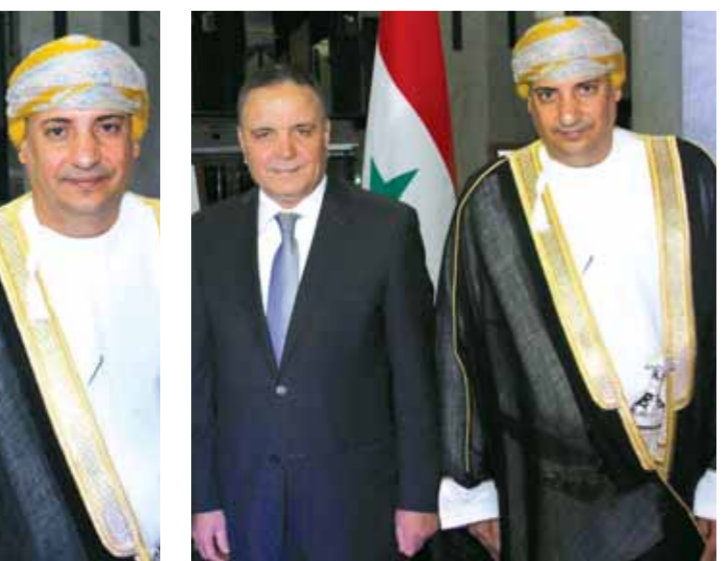
السفير الجزائري مع القائم بالأعمال