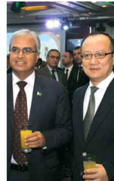
سفيرا الصين وباكستان