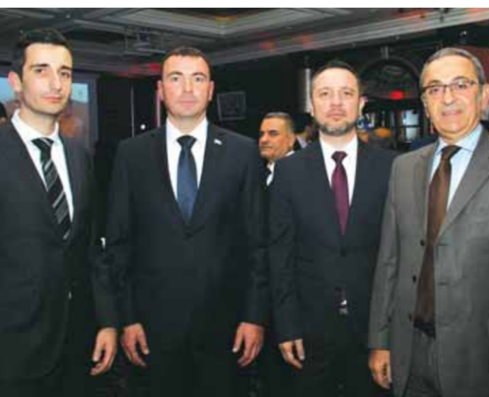
مازن حمور ونائب السفير الروماني وسفير صربيا ونائب السفير التشيكي