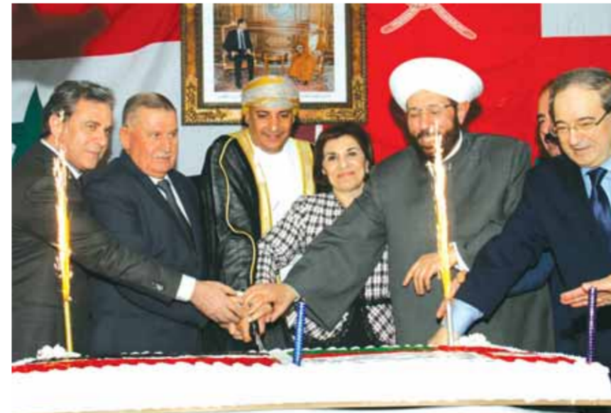
القائم بأعمال السفارة أثناء تقطيع الحلوى مع كبار الضيوف