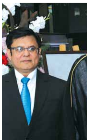
ومع السفير الهندي