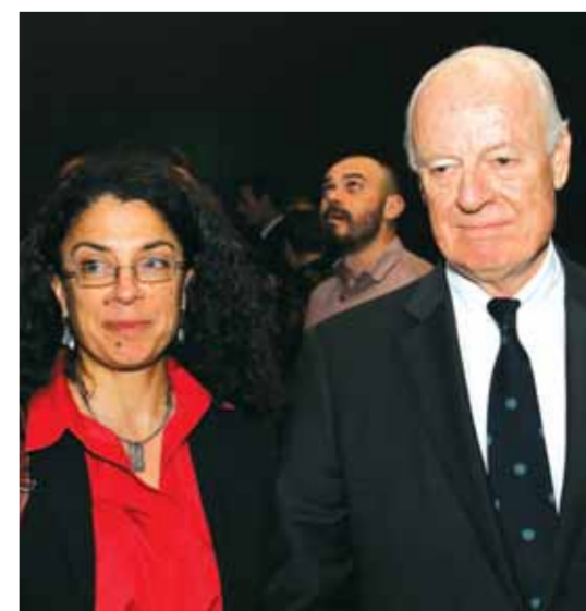
ستيفان دي ميستورا وستيفاني خوري

ت: طارق السعودي احتفالاً بالذكرى السادسة والأربعين للعيد الوطني العماني، أقام القائم بأعمال السفارة في سورية المستشار خالد بن سالم السعدي حفل استقبال مساء أمس في فندق داماروز حضره المستشار السياسية والإعلامية في رئاسة الجمهورية بثينة شعبان ووزراء المالية مأمون حمدان والاقتصاد والتجارة الخارجية أيوب ميالة والنقل علي حمود ونائب وزير الخارجية والمغتربين فيصل القداد ونائب رئيس مجلس الشعب نجدة أنزور ومفتي عام الجمهورية أحمد حسون. كما حضر الحفل المبعوث الأممي ستيفان دي ميستورا الذي كان في زيارة إلى دمشق ومديرة مكتبه في سورية ستيفاني خوري وعدد من السفراء العرب والأجانب المعتمدين في سورية وعدد من أعضاء مجلس الشعب وحشد من رجال الأعمال وعلماء الدين وفناني وإعلاميين.