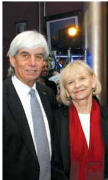
سفيرا التشيك وكوبا