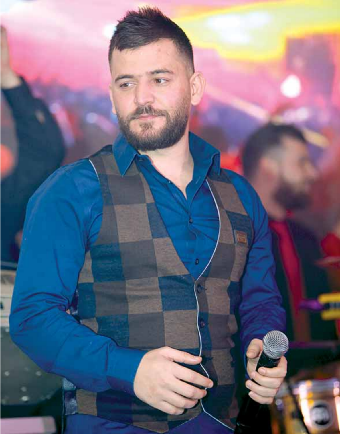
النجم حسام جنيد يغني في حفل الزفاف الأول من «الفرحة الرابعة» الذي أقامته شركة سيريل لـ ١٢٠ شاباً وشاباً من أبطال الجيش العربي السوري والدفاع الشعبي. دمشق - فندق داما روز - صالة المتنتبي ٠٦ / ٠٢ / ٢٠١٧.