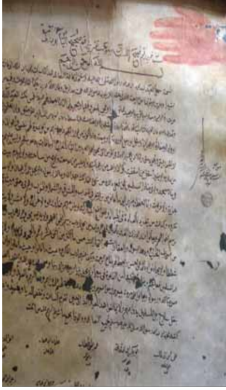
صورة في دير سانت كاترين لرسالة الرسول «محمد»

يعد الدير مزاراً سياحياً كبيراً حيث تقصده أفواج سياحية من جميع بقاع العالم، كما يقوم المسيحيون بالحج إليه، ويدير شؤون الدير رهبان من الكنيسة