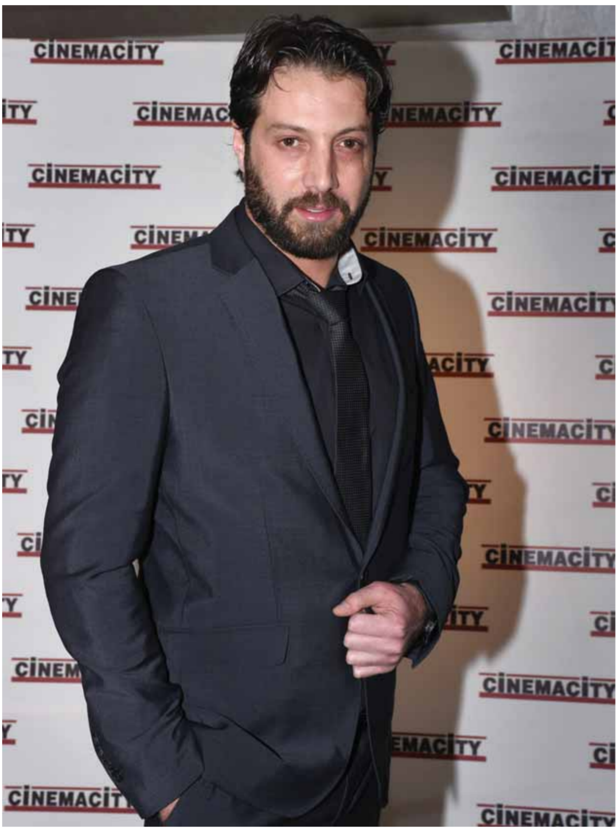
| الوطن- «ت، طارق السعدوني»

المثلث السوري النجم محمد الأحمد خلال حضوره حفل افتتاح فيلم «رجل وثلاثة أيام» الذي يؤدي فيه دور البطولة المطلقة.