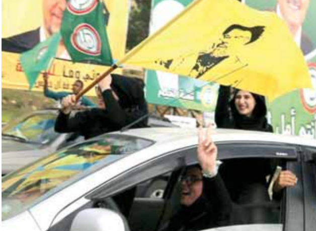
من فرحة انصار حزب الله وأمل في مرجعيون أمس

وتحدث عن تراجع بيئة المقاومة... ولفت نصر الله إلى أن «استمرار الخطابات الحادة والتخريبية التي رافقت الحملات الانتخابية سيؤدي إلى مشكلة»، داعياً للعودة إلى خطاب التهدئة، ومشيراً إلى أن «مزيد الاستثمار بالتخريب هدفه إحداث فتنة في البلد». ولخص إلى القول: إن «الانتخابات انتهت وأمامنا استحقاقات عديدة أبرزها انتخابات رئاسة البرلمان وتشكيل الحكومة» مؤكداً أن «هوية بيروت العروبية والمقاومة ستناعد وزيادة عد الباصات..» أو أكثر خلال الفترة القادمة بموجب العقد الموقع مع إحدى الشركات الاستثمارية الخاصة التي استقدمت الباصات