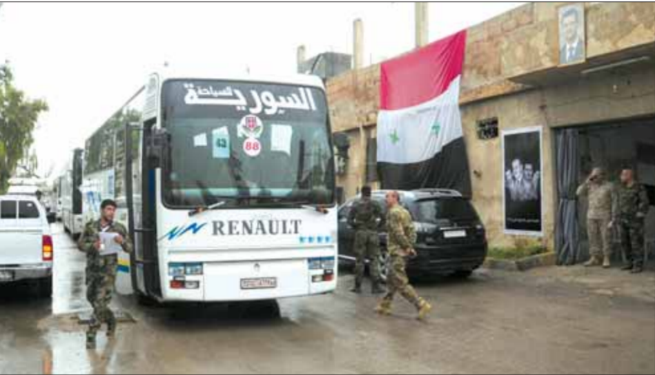
تواصل تجهيز الحافلات لإخراج الدفعة الخامسة من الإرهابيين وعائلاتهم من يدا وبيلا وبيت سحم (سانا)

الشمال وحماة الجنوبي تباطؤاً على التحديتات التي تمر بها سورية، واستثمر الانتصارات النوعية التي تحققتها القوات المسلحة يوماً بعد يوم بمواجهة التنظيمات الإرهابية في مختلف المناطق. وأوضح أن الحكومة تتابع ما تم وضعه من خطط ورؤى ومشاريع في البين الحكومي بشكل كامل وذلك عبر الوزارات واللجان المختصة واجتماعات مجلس الوزراء والاستجابة للمتغيرات كلها. وركز نواب الشعب على العديد من الأمور الخدمية والعيشية وخصوصاً فيما يتعلق بزيادة