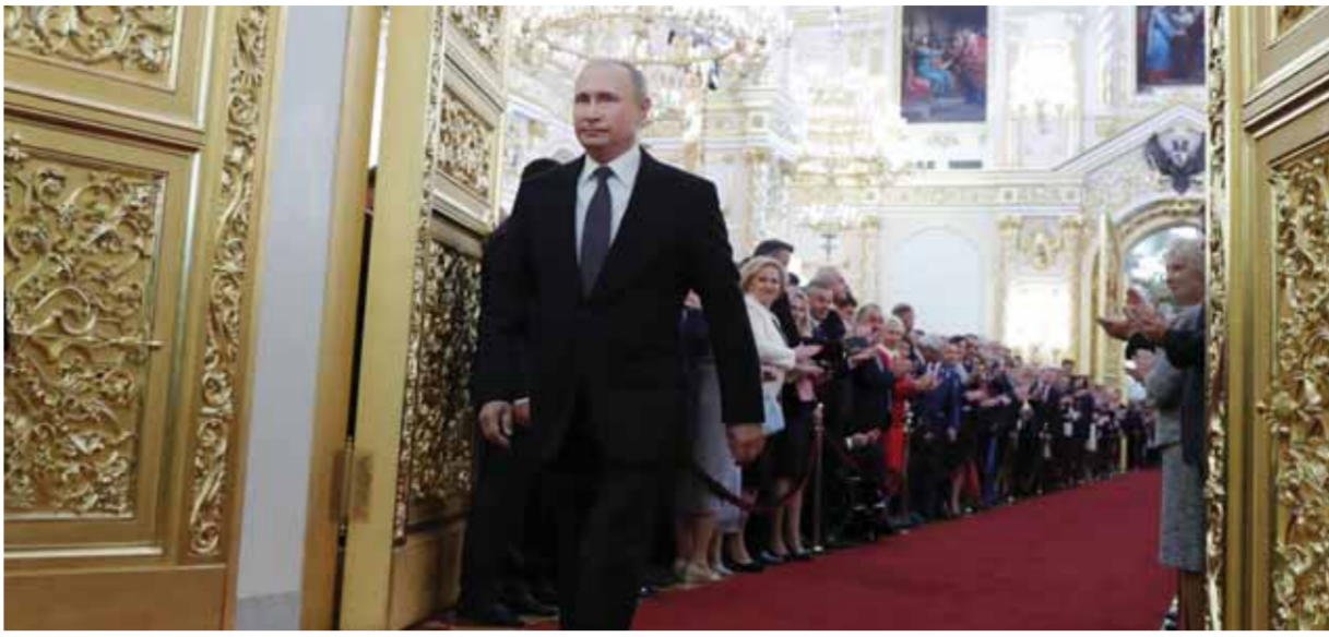
الرئيس الروسي فلاديمير بوتين متوجهاً إلى صالة التصويب في الكرملين - موسكو

على رئيس الحكومة تقديم الوزراء في مدة لا تتجاوز أسبوعاً ومن المتوقع أن يجتمع الدوما الرئيسية للسنات القادمة هي زيادة الدخل الحقيقي للمواطنين، الروسية التي يرأسها دمفيديف منذ عام ٢٠١٢ استقبلتها في وقت سابق أمس بعد مراسم تنصيب