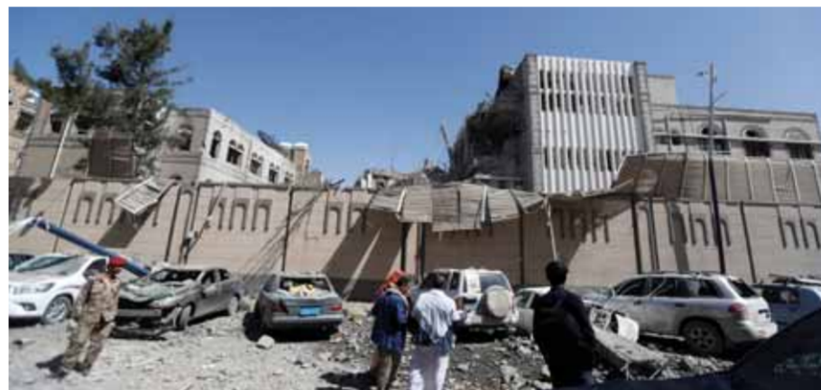
الدمار الذي تسبب به طيران آل سعود على القصر الرئاسي في صنعاء أمس

وأفاد مصدر عسكري يعني بمقتل وجرح العديد من الجنود السعوديين خلال تصدي الجيش واللجان لحفهم المسنود بغارات مكثفة للتحالف السعودي لتغطية عملية التقدم باتجاه جبل الشرفه بنجران. وأكد المصدر نفسه أن القوات السعودية لم تتمكن من إحراز أي تقدم باتجاه مواقع الجيش اليمني واللجان الشعبية في جبل الشرفه المطل على مدينة نجران من الناحية الجنوبية. تزامناً مع ذلك، تمكن الجيش واللجان من إحباط عملية زحف واسعة للتحالف باتجاه عدد من المواقع قبالة منفذ جبل الحدودي وتدمير آنية عسكرية سعودية في منطقة الفعجان