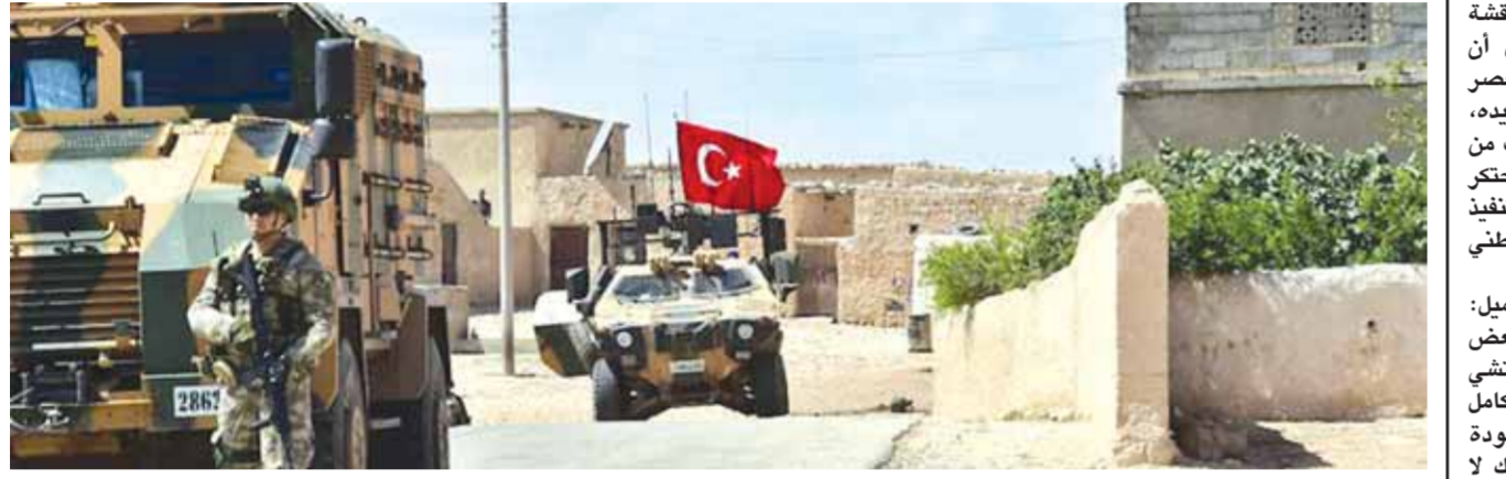
دمرعات لجيش الاحتلال التركي خلال نورية بالقرب من مدينة منبج

الشديدة ورفضها المطلق إزاء توغل قوات تركية وأميركية في محيط مدينة منبج والذي يأتي في سياق الجهادية والاحتلال التركي والاميركي المتواصل على سيادة وسلامة وحدة الأراضي الجمهورية العربية السورية وإطالة أمد الازمة في سورية وتعفيدها. وأضاف المصدر: إن الشعب السوري وقواته المسلحة الباسلة الذي حقق الإنجازات المتتالية على المجموعات الإرهابية بمختلف سمياتها، هو أكثر تضامناً وعزيمة على تحرير كامل التراب السوري المقدس من أي وجود أجنبي والحفاظ على سيادة ووحدة سورية أرضاً وشعباً. الموقف السوري المتجدد إزاء العدوان على أراضيها، جاء على وقع استمرار التحركات العدوانية التركية باتجاه مدينة «منبج»