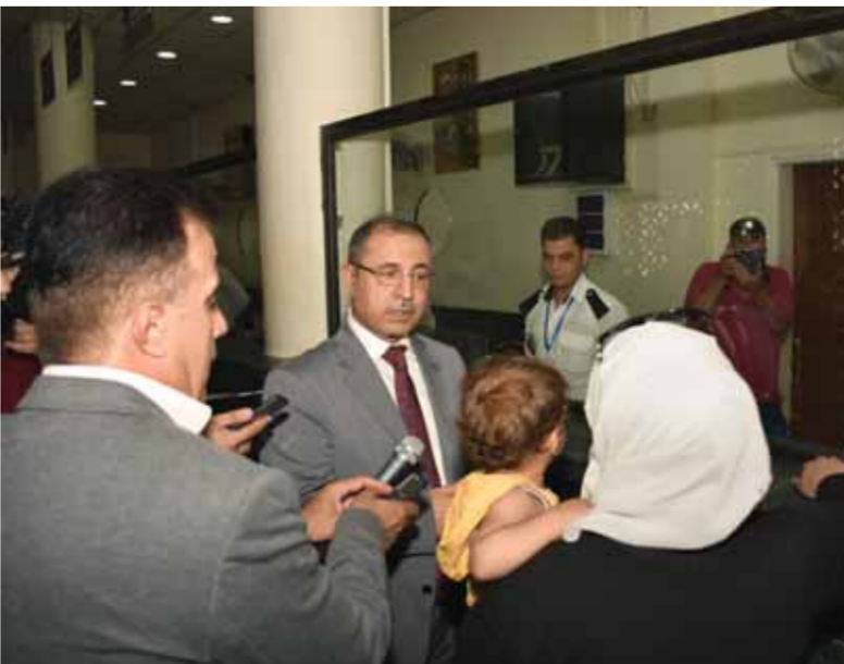
وزير الداخلية يستمع إلى انطباعات المواطنين عن الخدمات

كشف وزير الداخلية محمد الشعار عن ازدياد نسبة عودة السوريين من لبنان بما يقارب ٣٠ بالمئة خلال الشهرين الماضيين مقارنة بذات الشهرين في العام الماضي، معتبراً أن هذا يدل على شعور المواطنين بالاطمئنان نتيجة الانتصارات التي حققتها القوات المسلحة في سورية. ورافقت «الوطن» الشعار أمس في جولة إلى معبر جديدة يابوس الحدودي مع لبنان للاطلاع على أرض الواقع على الإجراءات التي يتخذها المعبر لتسهيل إجراءات دخول ومغادرة المواطنين وخصوصاً مع ازدياد عودة السوريين من الأراضي اللبنانية. وفي تصريح خاص له الوطن، قال الشعار: ارتفع نسبة عودة السوريين جاء نتيجة الاستقرار والأمان والثقة بالدولة السورية بقيادة الرئيس بشار الأسد. وخلال الجولة أكد الشعار على تقديم أفضل الخدمات لجميع المسافرين على قدم المساواة مشدداً على إعطاء صورة إيجابية لكل عناصر قوى الأمن الداخلي.