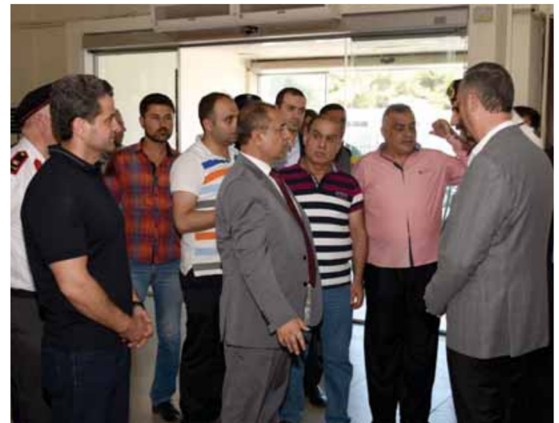
ويوجه بتسيير وتسريع الإجراءات

وشدد الشعار على التدقيق في جوازات السفر وتسهيل الإجراءات بما يضمن إنجازها بالسرعة القصوى. وأكد الشعار ضرورة المتابعة المستمرة والمباشرة من الضباط، مشدداً على عدم ارتكاب أي خطأ وتلافي كل تقصير تحت طائلة المسائلة، مؤكداً على التشديد بالإجراءات لكن ليس على حساب السرعة في إنجازها. والتقت «الوطن» العديد من القادمين والمغادرين، فكانت الاطلاعات بسرعة إنجاز إجراءات قنومهم ومغادرتهم، فقال أحد القادمين: لم يكن هناك أي تعقيد في إجراء معاملته، مضيقاً: إنه أسبوعياً يدخل إلى البلاد. وأكد مواطن لبناني أن المعاملة ممتازة من الموظفين على المعبر وأنه لا يوجد أي تأخير في الإجراءات وهذا ما يعطي صورة عن الدولة السورية ومدى احترامها للقادمين، وأشادت قادمة سورية بسرعة الإجراءات وحسن التعامل رغم وجود ازدحام كبير من المسافرين في الصالة. وأجرت الوزارة صيانة للمعبر الحدودي ليكون واجهة حضارية للدولة والشعب السوري أمام القادمين من العرب والأجانب.