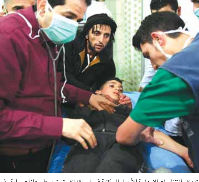
أحد ضحايا استهداف التنظيمات الإرهابية للأحياء السكنية في حلب بقذائف تحتوي على غازات سامة

«بما يمثل من بعد سياسي في مواجهة المحاولات الجارية لشطب حق العودة والتصدي لصفقة القرن، وتعزيزاً لنهج المقاومة والترابط مع ضلالت شعبنا في داخل فلسطين، وصموده على طريق التحرير والعودة». وطالب المجتمعون محافظة دمشق، وكل الجهات المختصة في الدولة، بالإسراع في العمل لإعادة البنية التحتية في الخيم، تمهيداً لعودة الأهالي الفلسطينيين والسوريين إليه.