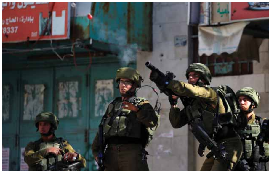
جندي تابع للاحتلال الإسرائيلي يطلق قنابل مسيلة للملوح باتجاه الفلسطينيين خلال اشتباكات في الخليل

أن صفقة القرن تركب الدولة الفلسطينية من منطقتي «أ» و«ب» في الضفة الغربية وأجزاء من المنطقة «ج» فقط وتعطيها عاصمة قرب القدس وليس فيها.