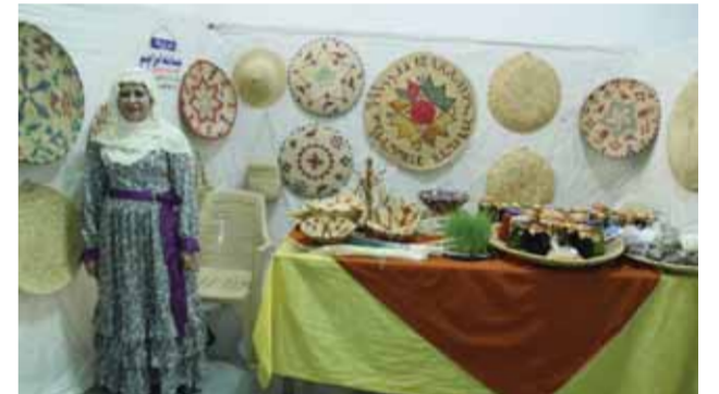
طرطوس - الوطن