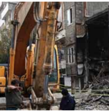
استمرار الاعتداء على الأملات العامة في إيران خلال أعمال الشغب الأخيرة

وفق بيان صادر عن مكتب الرئيس الباكستاني، عبر الأخير خلال اللقاء، بإشادته بدعم الحازم من قبل المرشد الإيراني السيد علي خامنئي للشعب الكشميري. وشدد على أن بلاده وإيران تربطهما علاقة ثابتة وثيقة قائمة على أساس القواسم الدينية والثقافية والشعبية والمصالح المشتركة. وأشار إلى أن «العلاقات الوثيقة مع جميع الدول المجاورة، خاصة إيران، تعد من أولويات سياسة باكستان الخارجية». وانتقد أوضاع حقوق الإنسان في منطقة كشمير الهندية، مؤكداً أن باكستان «ستستمر في دعم حقوق الإنسان في جميع المجتمعات البشرية». ولفت الرئيس الباكستاني إلى أنه طرح في هذا الإطار لتأسيس شبكة بالغة الإنجليزية من قبل باكستان وتركيا وماليزيا لتتعاون في إطار مواجهة ظاهرة التخويف من الإسلام. من جهته قال السفير الإيراني، إن «باكستان وإيران دولتان شقيقتان»، مشيراً إلى أن «السلام والاستقرار الإقليميين يشكلان أولوية مهمة لهما».