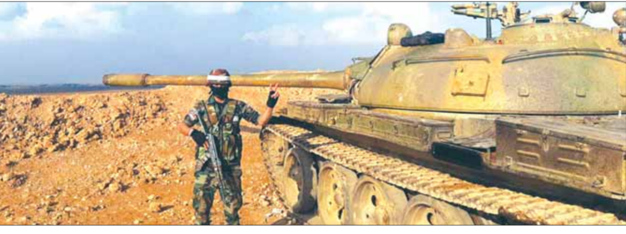
وحدات من الجيش العربي السوري توسع انتشارها على الطريق الدولي الحسكة حلب وتدخل قرى الكورلية وتل اللبن وأم الخير بريف تل تمر الغربي

جاء بمبادرة روسية أحادية الجانب والتمز به الجيش السوري من طرف واحد أيضاً. إلى ذلك أفاد مصدر عسكري موقع «روسيا اليوم»، بأنه تم فتح معبر أبو الزين بريف الباب، والذي يربط أرياف حلب وإدلب مع حلب ومناطق الدولة السورية أسماء الحالات الإنسانية. وأضاف المصدر، بأن حافلة النقل الداخلي موجودة كل يوم لنقل من حماة واللاذقية، مقابل وقف عملية الجيش السوري التي انطلقت قبل ذلك وطهرت مناطق واسعة من حمزة وجنوب إدلب، وكانت تأتي هذه التطورات في ريف إدلب تزامناً مع تعزيز وحدات الجيش