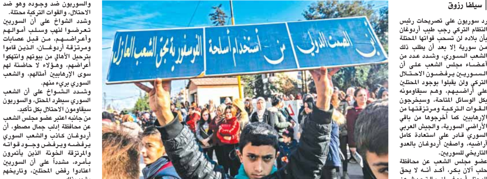
مظاهرة أمام مكاتب الأمم المتحدة في مدينة القامشلي للاحتجاج على قتل الأطفال من قبل قوات الاحتلال التركي

ويجددون مواقفهم الراضية لاحتلال أراضيهم بكر: التحرير قادم.. الشواخ: سيخرج بالمقاومة.. مصطو: عدو تاريخي ويجددون مواقفهم الراضية لاحتلال أراضيهم بكر: التحرير قادم.. الشواخ: سيخرج بالمقاومة.. مصطو: عدو تاريخي