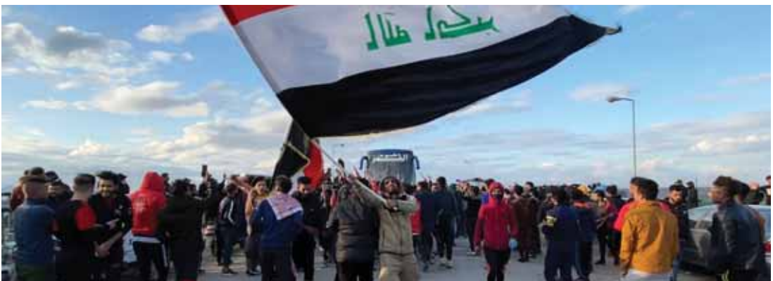
تواصل الاحتجاجات المناهضة للحكومة في مدينة الناصرية

فإن فصائل المقاومة بأتم جهوزيتها». ووصف الخزعلي المتظاهرة التي تستنطق يوم الجمعة المقبل للطالبة بإخراج القوات الأميركية من العراق، بأنها «ثورة العشرين الثانية التي ستطردهم الأميركيين مثلما طردت البريطانيون قبل ١٠٠ عام».