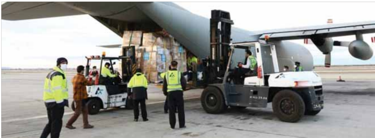
وصول مساعدات وأجهزة طبية لمكافحة فيروس كورونا إلى إيران

أشار المتحدث باسم الحكومة الإيرانية علي رباعي في مؤتمر صحفي أمس، إلى أن «إيران تعاملت بشغافية منذ اللحظة الأولى لتأكيد وصول فيروس كورونا إلى البلاد»، مضيفاً: «نعمل اليوم على رفع مستوى السلامة والصحة العامة». ولفت رباعي وفق ما نشرته وكالة «سانا» إلى أن إيران، على عكس بعض الدول، «لم تفضل مصالحتها الاقتصادية على سلامة شعبها، وأنها «تمكنت من مواجهة فيروس كورونا منذ اللحظة الأولى، وتعمل على السيطرة عليه بشكل جدي». وشدد على أن الحكومة تعمل على إعداد تسهيلات اقتصادية تخفف من أضرار آثار فيروس كورونا على السوق، وأنها أصدرت قرارات بمضاعفة إنتاج الأقفعة الطبية المختصة وتصنيع الأجهزة المخبرية اللازمة للكشف عن الفيروس، بالتعاون مع الشركات العراقية ووزارة الدفاع. في السياق، توفي عضو مجمع تشخيص مصلحة النظام في إيران، محمد ميرجمي جراء إصابته بفيروس كورونا، وأعلنت وزارة الصحة الإيرانية أن عدد المصابين بفيروس كورونا وصل إلى ١٥٠١، وعدد الوفيات ٦٦ وفاة، في حين بلغت حالات الشفاء ٢٩١ حالة. بدوره أعلن مدير عام منظمة الصحة العالمية تيدروس أدهانوم غيبريسوس، عن وصول فريق خبراء من المنظمة إلى إيران لمساعدة سلطات البلاد في التصدي لانتشار فيروس كورونا الجديد. إلى ذلك قال وزير التنمية الاقتصادية الروسي مكسيم ريشتنيكوف، إن تداعيات انتشار فيروس كورونا على الاقتصاد الروسي ستكون مؤقتة، وفي المحصلة سيعود نمو الاقتصاد إلى المستوى الطبيعي، وذلك وفقاً لما نشرته وكالة «نوفوستي».