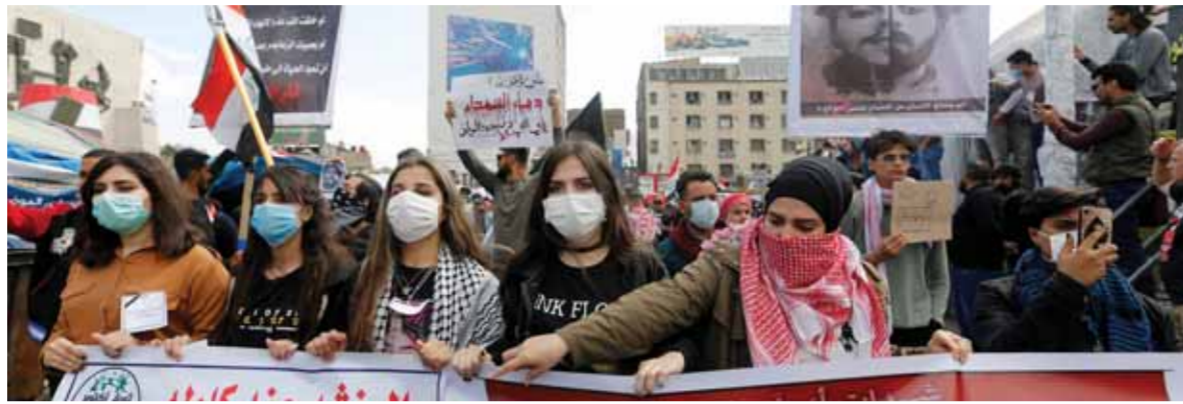
استمرار الاحتجاجات المناهضة للحكومة في بغداد

وميسان التي وصلت إلى أكثر من ٥٠ بالمائة، لذلك نحتاج إلى ثورة حقيقية من أجل كبح جماح هذه الأحزاب وتجاهلهم لمطالب الشعب المنفض... وأشار الزامل، إلى أن «الثورة الشعبية تتحول حول خطوتين لا ثالث لهما وهي أن تمرير الحكومة المستقلة التي لا تنتمي لأي جهة أو حزب أو دولة معينة، بدأ الذين يشعرون بالانعصام تحت قبة البرلمان العراقي ومنع دخول أي مرشح من الأحزاب الفاسدة ومنع تمرير أي كابينة مرشح يرخص لأي حزب في فرض إرادة الفساد والمحاصصة وإعادة تارة أخرى». وأضاف، أن «الخطوة الثانية وكما يقال - آخر الدماء التي - إذا لم نتجح خطوة الاعتصام البرلماني يكون دور الشعب المنفض بتطبيق