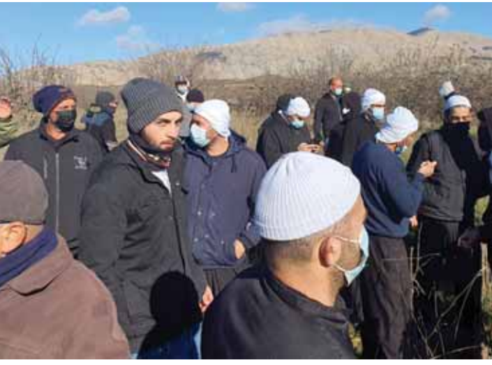
احتجاجات أهالي الجولان السوري المحتل على إقامة كيان الاحتلال المراوح توريبينية فوق أراضيهم الزراعية (سانا)

بجزءها من مواجهة الأهالي طلبت منهم الابتعاد قليلاً حتى يأخذوا فرصة بالانسحاب. وأوضح المقت أنه وفور مغادرة قوات الاحتلال المنطقه اتخذ قرار ميداني من قبل الأهالي بالتوجه لمركز شرطة الاحتلال الموجودة في قرية مسعدة المحتلة، حيث جرى تطويقه والطلب بإطلاق سراح المعتقلين، وقال: «كنا جاهزين لكل الاحتمالات، حيث جرت فاضاضات يطلب من الاحتلال، لينتهي الأمر بإطلاق سراح ستة من المعتقلين، على أن يتم (اليوم) إطلاق سراح اثنين آخرين، كما أعلن الاحتلال تجديد مشروع المراوح لسته أشهر قادمة». وأكد المقت أن الاحتلال هزم بالميدان، بصود وعزيمة الأهالي بالجولان، وهو أدرك حجم الرفض والتسايق الجولان سيسمحون بمرور هذا المشروع فقط على جنهم، لأنه مشروع احتلالاً للاستيلاء على الأرض، وهو يريد تهجير الأهالي وإقامة سوتونات بذريعتها.