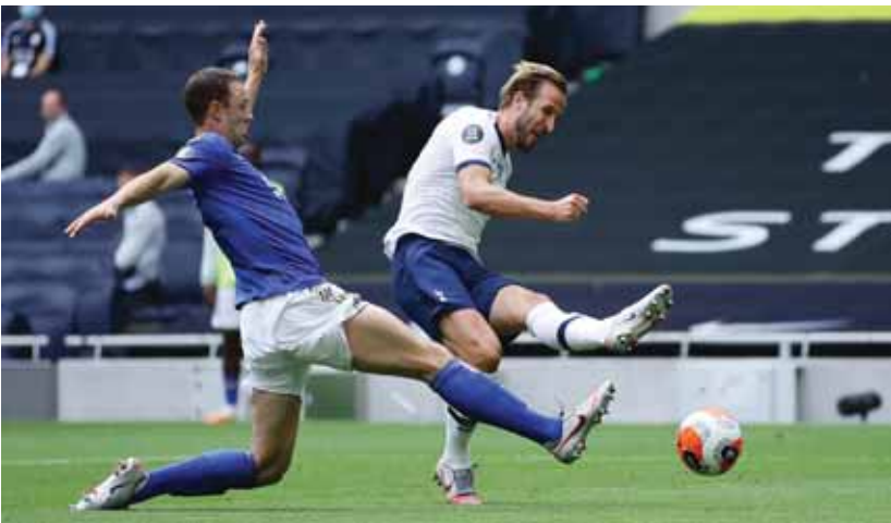
مواجهة ثارية بين توتنهام وليستر