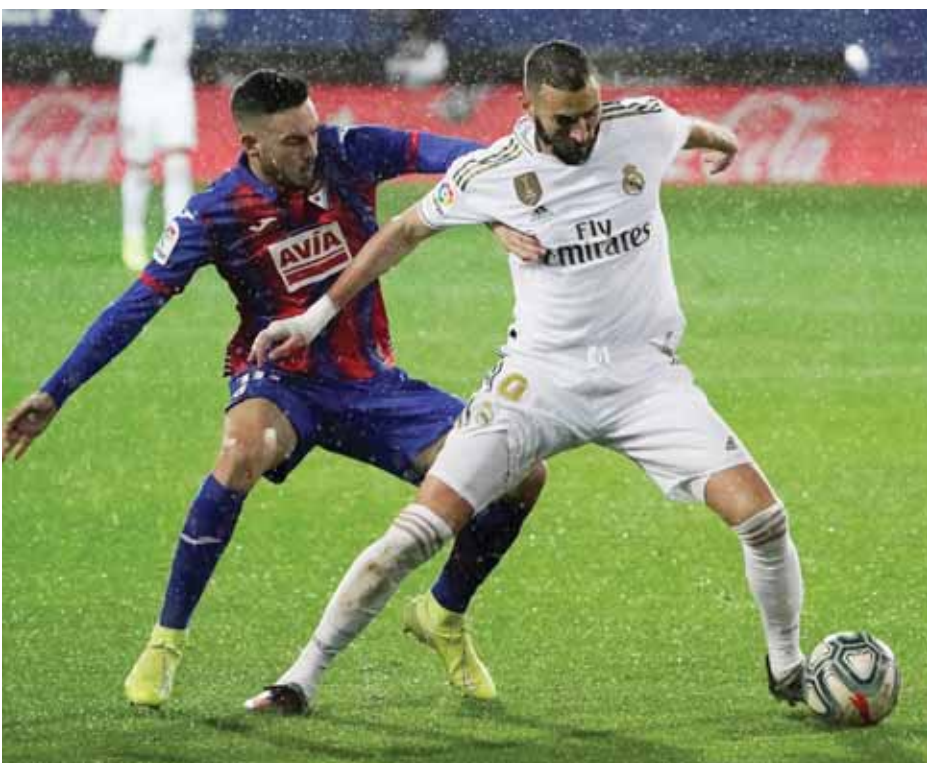
إيبار محطة سهلة للريال نظرياً

سلتا فيغو × الأفييس (٣،٠٠)، غرناطة × بيتيس (٥،١٥)، قاش × خيتافي (٧،٣٠)، إيبار × ريال مدريد (٩،٢٠)، الاسباني - الأسبوع ١٤ تورينو × بولونيا (١،٣٠)، ساسولو × ميلان، إنتر ميلانو × سبزييا، بينيفيتو × جنوى، كالابري × أودينيزي (٤،٠٠)، أتالانتا × روما (٧،٠٠)، لاريو × نابولي (٩،٤٥)،