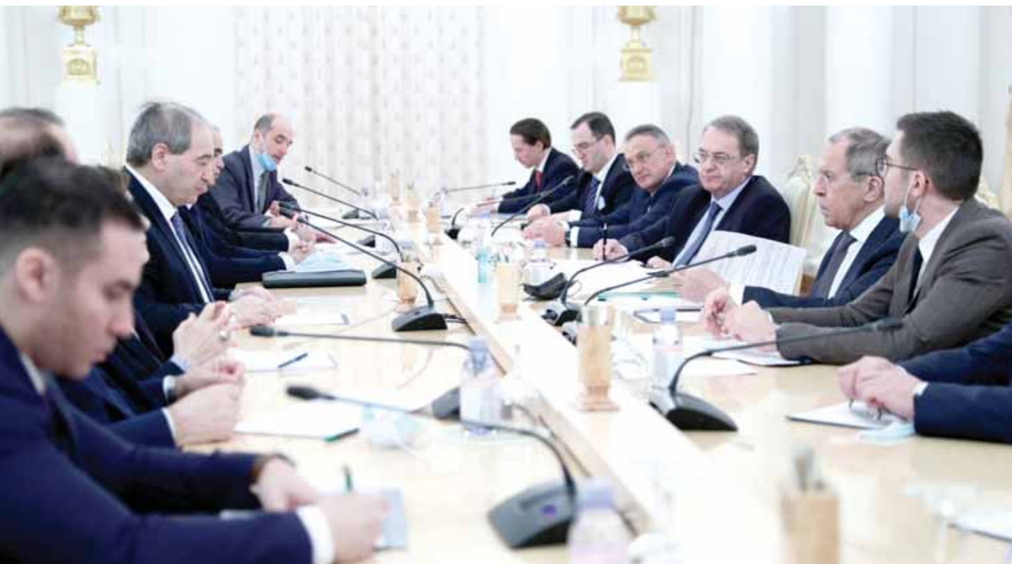
من اجتماع وزير الخارجية والمغتربين فيصل المقداد مع نظيره الروسي سيرجي لافروف في موسكو الخميس الماضي

وليس إلى أي نوع من التعاون بين القوات العسكرية... وإذا أرادت الإدارة الأميركية أن تتسحب بشرف وكرامة من سورية، فالتاريخ يوجب أن يتسحب من سورية، ولا لتوليات محددة قبل أن تسري إلى أي شيء آخر، وبعد ذلك نأخذ حثديث.