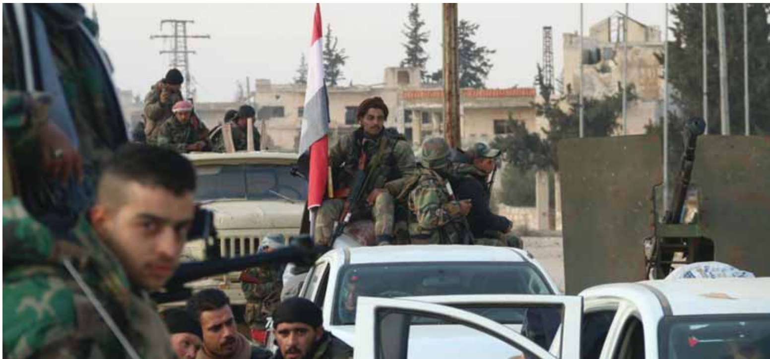
وحدات من الجيش العربي السوري في محيط بلدة عين عيسى

ويثبت المصادر، أن ضرورة الانشغابات أجبرت أسر سلووم ورماته المغتلة لقريني البوشان والخالدية المحادية لطرف حلب-القرية- المحسنة شرق عين عيسى، بينما حدثت هذه التفتيات منذ يوم الخميس الفاتت حجوما عسكرياً واسعاً وعميقاً، على مواقع ميليشيات قوات سورية الديمقراطية-فسد، في بلدة عين عيسى.