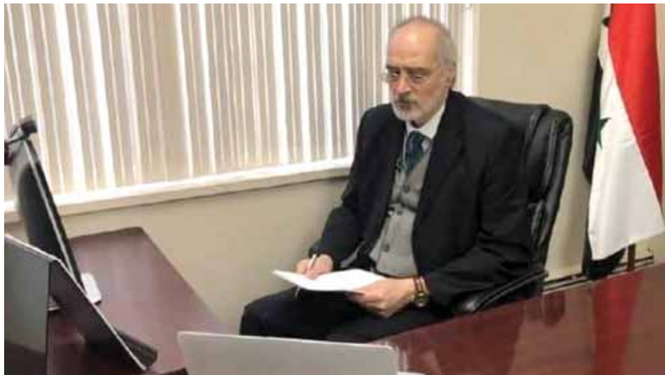
نائب وزير الخارجية والمغتربين مندوب سورية الدائم لدى الأمم المتحدة بشار الجعفري خلال جلسة لمجلس الأمن أمس عبر الفيديو.

الجعفري بين أنه بعد مئة عام على إنشاء أول منظمة دولية متعددة الأطراف هي عصبة الأمم نجد أن بعض الدول الغربية وسعت نطاق جرائمها ونهبها لنشل زعزعة أمن واستقرار شعرات الدول الأعضاء في الأمم المتحدة واحتلال أراضيها ونهب ثروتها وأثارها ونطقها وغازها ومصائر رزق شعوبها ولم تكف بذلك بل حاولت تشويه تراثنا العالمي وإعادة صياغته واستخدام الكذب وسيلة للترويج للعدوان والتدمير والخراب وسخرت وسائل إعلامها والمخالف الدولية بما فيها مجلس الأمن للترويج للأكاذيب والبذاء عليها لتدمير دولنا والإضرار بشعوبنا كما فعلوا سابقاً في العراق وليبيا وغيرها، مشدداً على ضرورة تنبه الدول الغربية لعواقب أفعالها، ودعمها للإرهاب، وتجنيد الإرهابيين الأجنبي، وتيسير سفرهم، ومنع استعدادهم ومساندتهم، والتغطية على استخدام المنظمات الإرهابية أسلحة كيميائية، لأن ذلك سيرتد عليها ما يستلزم من تلك الدول مراجعة سياساتها الخاطئة تجاه سورية والعدول عنها.