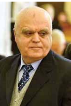
محافظ درعا مروان شريك

محافظ درعا مروان شريك، أن «منطقة طفس هي المنطقة الوحيدة بريف درعا التي لم تحصل فيها تسوية، والآن يجري العمل على إجراء هذه التسوية وينتهي الأمر. ولا توجد اشتباكات نهائية».