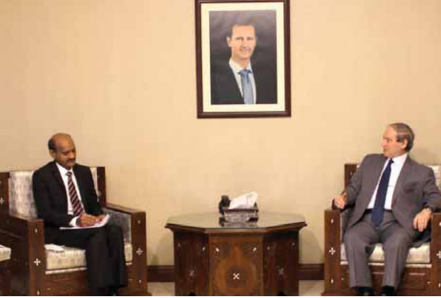
وزير الخارجية والمغتربين فيصل المقداد خلال استقبال سفير الهند في سورية حفظ الرحمن

إلى سورية، كمساهمة منها للتخفيف من آثار الإجراءات القسرية الأحادية الغربية التي تفرضها أميركا ودول حليفة أخرى على الشعب السوري. وبين عباس أن الدفعة الأولى من المساعدات الغذائية انطلقت من الأراضي الهندية، وهي في طريقها إلى سورية، وهذه المساعدات «تسعى من خلالها الحكومة الهندية للتخفيف من معاناة شعبنا جراء الحصار الظالم الذي تفرضه قوى الاستعمار الجديد على بلدنا».