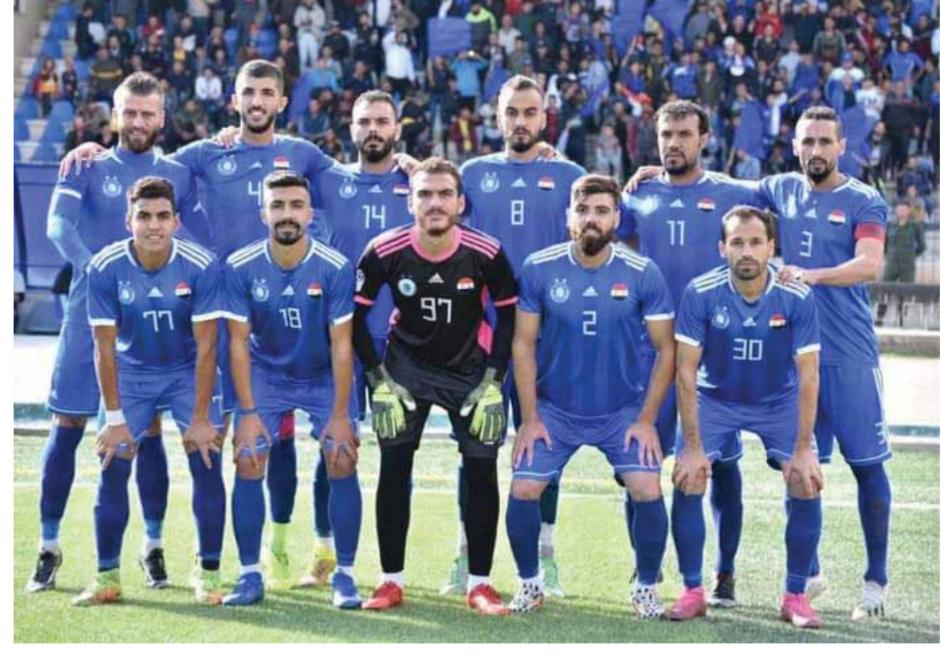
الفتوة .. قفطانا تذرنا بالخطر

لم يكن أشد المشائمين بكرة رجال الفتوة يتوقع أن يصل الحال فيه إلى ما وصل إليه الآن بعد مرور عشر جولات من بداية الدوري السوري الممتاز حيث تقع كرة الأزرق في الترتيب ما قبل الأخير بنقطتين ويتمتزين وتعذر الفوز وشح التهديد ويتبدل ثلاثة طواقم فنية. حكاية عدم الفوز لم يعان منها أزرق الدبير منذ موسم ٩٤ | ٩٥ حين عجز يومها عن الفوز حتى المرحلة ١٦ على حساب الوتية يهدفين مقابل هدف واحد. فيما عدا ذلك لم يسبق لنادي الفتوة أن عاش صيباً مستمراً عن تذوق طعم الانتصار طيلة الربع قرن الماضية.