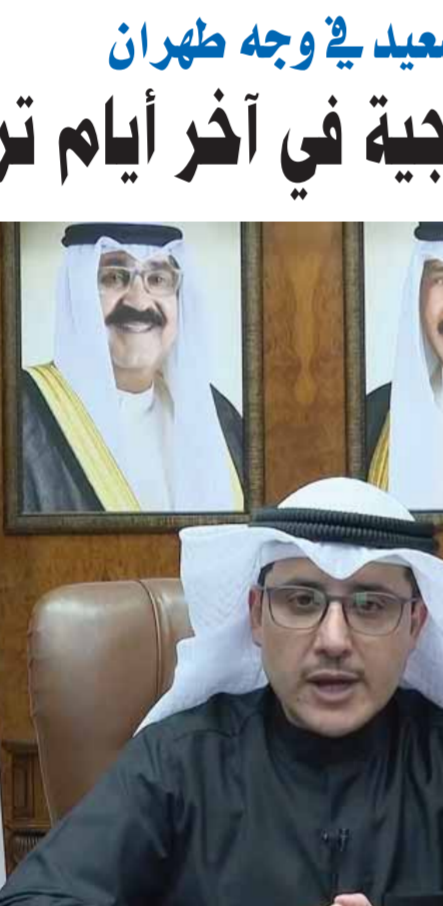
وزير خارجية الكويت أحمد ناصر الصباح أعلن أمس عن فتح الحدود بين قطر والسعودية

مجلس التعاون الخليجي، مؤكداً أنها ستكون صفحة جديدة في العلاقات الأخوية. وفي العهد السعودي محمد بن سلمان، الذي سارع إلى قلب صفحة الداء مع الدوحة، اعتبر أن القمة الخليجية ستكون قمة جامعة للكلمة موحدة للصف وستترجم تطورات السعودية ودول المجلس للشم والتضامن لمواجهة التحديات التي تشهدها المنطقة، على حد قوله. وفرضت السعودية والإمارات والبحرين ومصر حظراً دبلوماسياً على قطر، وقطعت روابط التجارة والسفر معها منذ منتصف عام ٢٠١٧ متهمه بإيها بدعم الإرهاب، وتصاعدت الحرب الإعلامية في وجه قطر، التي وقعت معاهدة للدفاع المشترك مع النظام التركي حيث أنشأ قاعدة عسكرية له على أرضها،