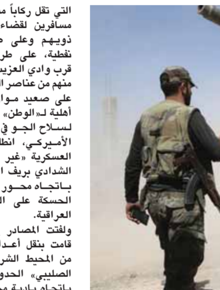
عناصر من الجيش العربي السوري يقومون بتمشط طريق دمشق الرقعة (عن الانترنت)

أكدت دمشق أن كل المحاولات لإعادة إحياء المشاريع المعادية ستفشل، والشعب السوري وجيشه الباسل الذي سطر ملاحم الصمود في معارك الشرف ضد الإرهاب وداعيه أكثر قوة وعزيمة في التصدي للحراب على سورية بأشكالها المختلفة، وهو سيحافظ على سيادة سورية ووحدتها أرضاً وشعباً وقرارها الوطني المستقل. وأدان مصدر رسمي في وزارة الخارجية والمغتربين في تصريح نشرته «سانا»، بأشد العبارات الاعتداءات الإيرانية التي استهدفت حافلة في منطقة كباجب على الطريق بين دبر ودير الزور، وكذلك صهاريح نقل المحروقات والسيارات المدنية على طريق أثريا السلمية، والتي أودت بحياة عدد من الشهداء المدنيين والعسكريين وجرح آخرين. وأكد المصدر أن هذه الاعتداءات الإرهابية المغادرة، التي تتزامن مع الاعتداءات الإسرائيلية المتكررة على الأراضي السورية،