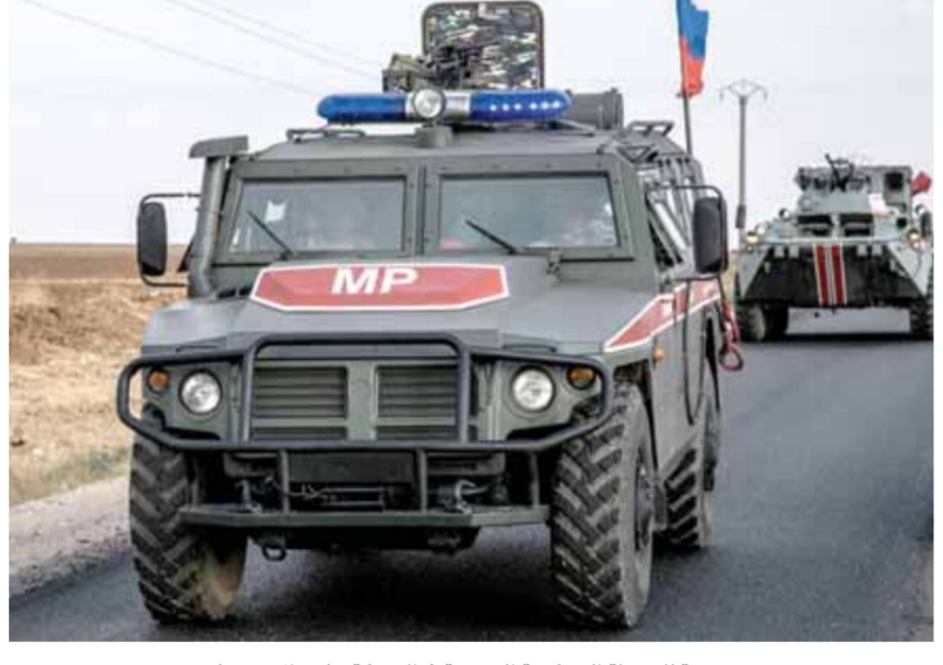
دورية للشرطة العسكرية الروسية في الحسكة

حماة - محمد أحمد خبازي المنطقة الشرقية - مراسل الوطن أمن الجيش العربي السوري منطقة أثريا، والطريق الدولية الرقة دمشق أمام وسائل النقل العابرة، من خطر بقايا فلول مسلحي تنظيم داعش الإرهابي. وبين مصدر ميداني لـ«الوطن»، أن عمليات الجيش بتشيط البداية الشرقية من بقايا فلول مسلحي تنظيم داعش توقف مؤقتاً أمس، بسبب الظروف الجوية السيئة، فيما ساد الهدوء الحذر وشبه التام المنطقة التي مسحها طيران الاستطلاع الحربي. وأوضح المصدر، أن تمشيط البداية خلال الأيام الماضية، أدى إلى تأمين منطقة أثريا والطريق الدولية الرقة دمشق أمام وسائل النقل العابرة، من خطر بقايا فلول مسلحي تنظيم داعش، الذي تكبد خسائر فادحة خلال عمليات التمشيط التي قام بها الجيش وغارات الطيران الحربي السوري والروسي المشترك. بأني ذلك في وقت تكثف فيه الشرطة العسكرية الروسية، من دورياتها بالقرب من بقول النفط شرق الحسكة، التي تحتلها أميركا، حيث سيرت أمس دورية جديدة بريف المالكية، وقالت مصادر محلية لـ«الوطن»: إن دورية من الشرطة العسكرية الروسية تضم أربع مدرعات تحولت في قرية عين ديوار شمال مدينة المالكية الملاصقة لحقول نפט الحسكة بمنطقة الريمان، وذلك برقعة حوامتين عسكريتين تؤمنان لها الخطأ الجوي على خط سيرها. وجدت فرنسا انتهاكها للسيادة السورية، حيث تسلل وفد رفيع المستوى برئاسة مدير قسم الدعم والأزمات في الخارجية الفرنسية إيريك شوفالبييه إلى مناطق شمال سورية، الواقعة تحت سيطرة ميليشيات «قسد»، إضافة لمناقشة سبل دعم المشاريع وتحقيق الاستقرار في المنطقة؛