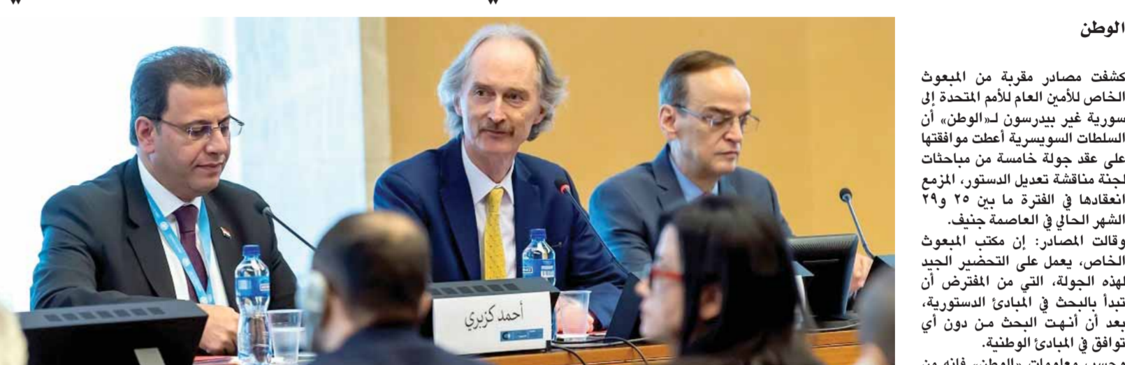
اجتماع لجنة مناقشة تعديل الدستور في جنيف