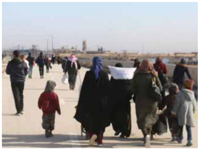
إعادة افتتاح ممر الصالحية البري لمرور الأهالي (سانا)

والتف المصدر إلى أن الطيران الحربي شن غارات مكثفة على مواقع الدواعش بالبادية الشرقية المشتركة ما بين محافظات حماة وحلب والرقعة، محققاً فيها إصابات عالية الدقة. مصادر إعلامية ذكرت من جهتها، أن العملية الأمنية الجديدة ضمن البادية السورية، بدأت بهدف تأمين طريق دير الزور حمص بعد تصاعد نشاط تنظيم داعش هناك، وعمليات التمشيط بدأت انطلاقاً من كبابج والشول غرب دير الزور، وصولاً إلى السخنة، وسط مشاركة جوية من مروحيات روسية بعمليات التمشيط.