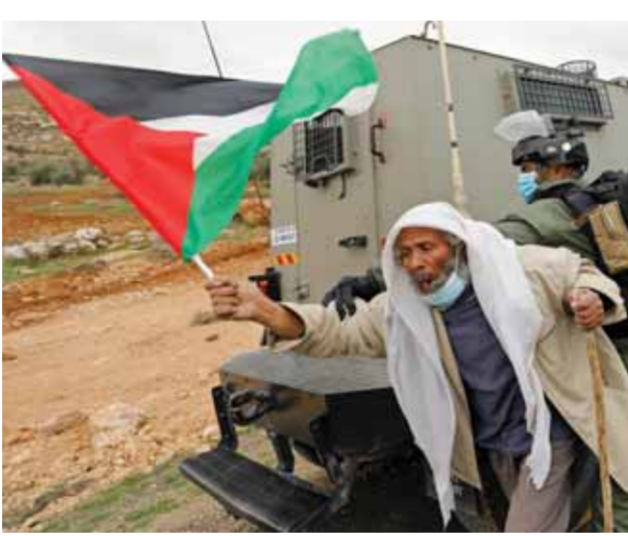
قوات الاحتلال الإسرائيلي تعتدي على فلسطيني خلال مظاهرة ضد المستوطنات في الضفة الغربية

وطني فلسطيني توحيدى خارج الأراضي المحتلة، وبعيداً عن اتفاقية أوسلو. وقال رجا: «نحن لن نشارك في أي مجلس تشريعي، ما لم يتم الإعلان الصريح والواضح الموفق لإلغاء اتفاقيات أوسلو». وبين أن الأهم وما يوقى القيادة العامة، ويشكل قاسماً مشتركاً، هو إعادة بناء منظمة التحرير على أساس البداية وخريطة الطريق التي تعيد حركة التحرر الوطني الفلسطيني المسار على الساحة الفلسطينية يكون