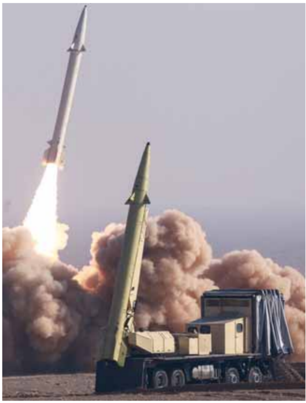
من المناورات الإيرانية التي جرت أول من أمس