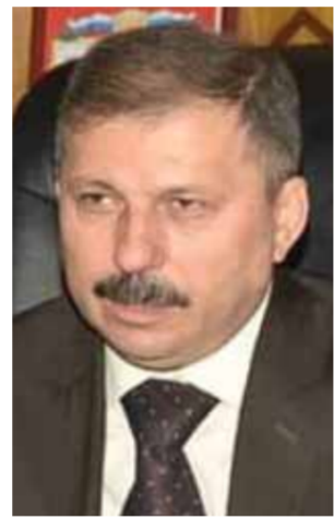
محافظ دير الزور فاضل نجار

والتف المصدر إلى أن الطيران الحربي شن غارات مكثفة على مواقع الدواعش بالبادية الشرقية المشتركة ما بين محافظات حماة وحلب والرقعة، محققاً فيها إصابات عالية الدقة. مصادر إعلامية ذكرت من جهتها، أن العملية الأمنية الجديدة ضمن البادية السورية، بدأت بهدف تأمين طريق دير الزور حمص بعد تصاعد نشاط تنظيم داعش هناك، وعمليات التمشيط بدأت انطلاقاً من كبابج والشول غرب دير الزور، وصولاً إلى السخنة، وسط مشاركة جوية من مروحيات روسية بعمليات التمشيط.