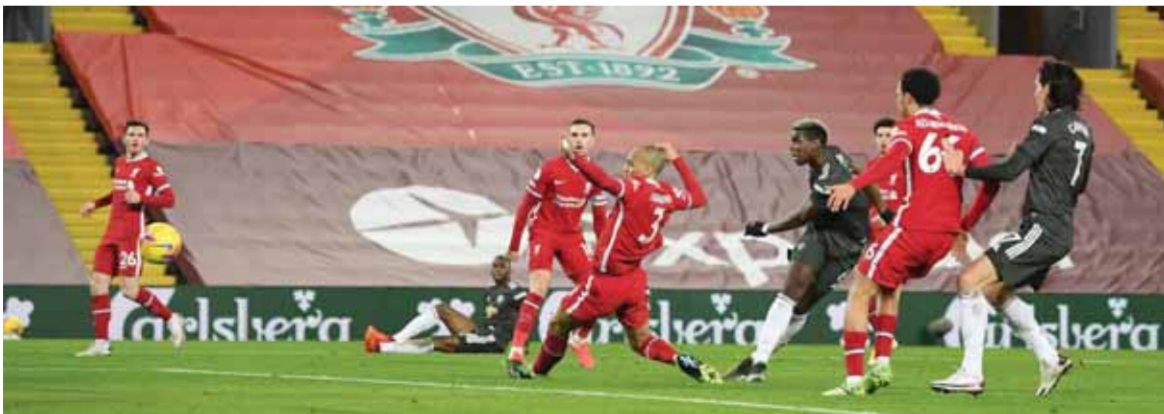
من مباراة ليفربول ضد مانشستر يونايتد