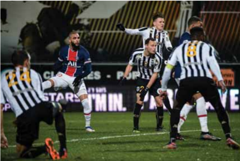
كورزاوا قائد الباريسي إلى الفوز

يدخل ميلان مرحلة حاسمة في مشواره بالدوري الإيطالي مع قرب نهاية الذهاب فيحل ضيفاً على كالياري بحثاً عن النقاط الكاملة التي تضمن له بطولة الشتاء، وبدأ لآزول الجولة ١٨ بفوز كبير على جاره روما في ديربي العاصمة واستعاد بولونيا نعمة الفوز بعد ثماني جولات كاملة على حساب هيلاس فيرونا بهدف ليصبح في منطقة دافئة نسبياً، وقلب سامبدوريا الطاولة على ضيفه أودينيزي فغلبه بهدفين لهدف، على حين أخفق تورينو بمغادرة مثل الهبوط ولو مؤقتاً بعد تعاقبه السلسلي أمام ضيفه سبيزيا الذي لعب بعشرة لاعبين لأكثر من ثمانين دقيقة.