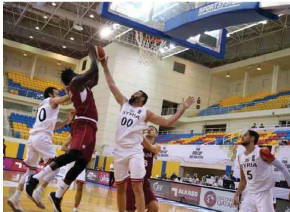
من فوز سورية على إيران

مع العلم أن الدوري البولندي سيتوقف في السادس من