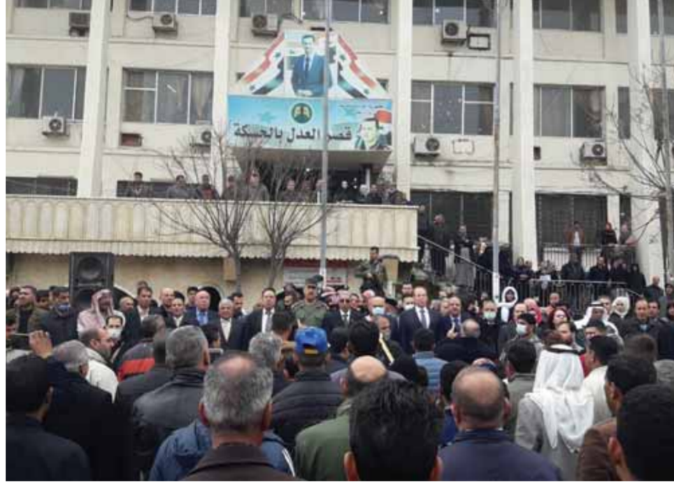
وقفة لأهالي مدينة الحسكة احتجاجاً على قطع المحتل التركي مياه الشرب مجدداً عنهم ورفضاً لانتهاكات ميليشيا «قسد» بحقهم