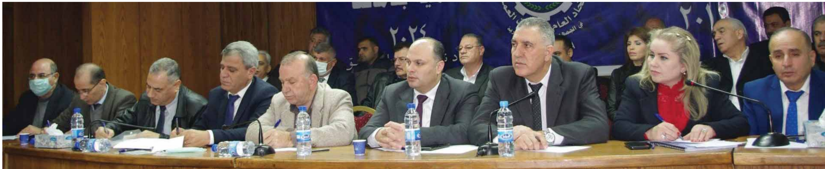
مؤتمر نقابة عمال النفط بدمشق