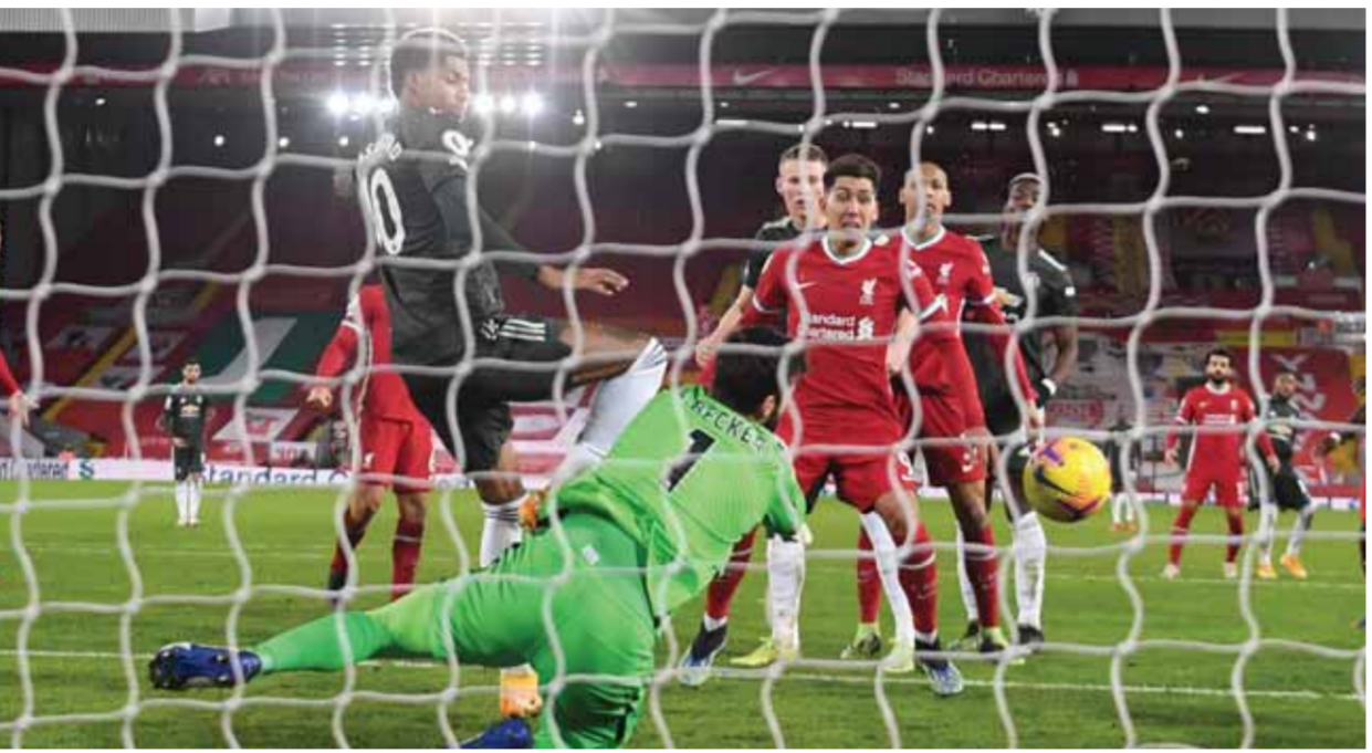
وصمتت الشباك في كلاسيكو الحمر