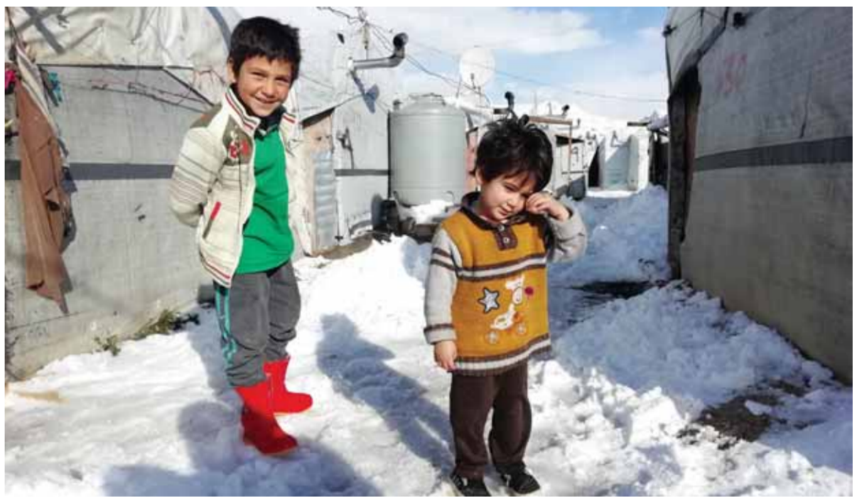
اللاجئون السوريون يواجهون مسألة تدفئة وتدفئة مساكنهم في بلدة عرسال اللبنانية