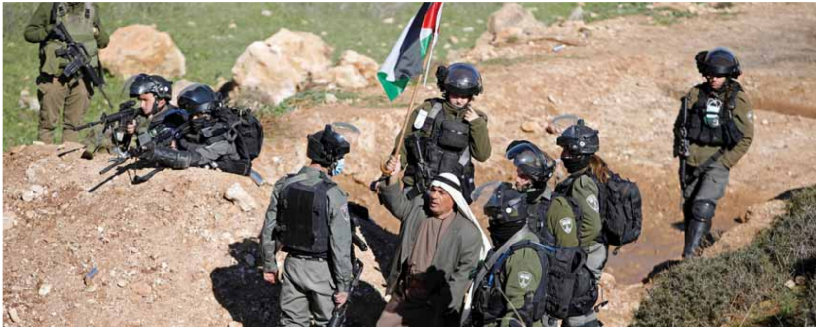
استمرار التفاهات ضد الاستيطان في الضفة الغربية

جددت وزارة الخارجية الفلسطينية مطالبتها المجتمع الدولي بتجميد تهويد القدس الدولية للفلسطين الإحتلالية ووقف اعتداءات الاحتلال الإسرائيلي التواصلة عليها. وأدانت الخارجية في بيان أمس قلته وكالة الأنباء الفلسطينية في مقدمتها المسجد الأقصى ووقف اعتداءات الاحتلال الإسرائيلي التواصلة عليها. وأشارت الخارجية إلى أن تصعيد الاحتلال اعتداءاته على المسجد الأقصى يأتي في إطار تنفيذ مخططات تهويده متخفية المنظمات الدولية المختصة في مقدمتها منظمة الأمم المتحدة للتربية والعلم والثقافة «يونسكو» بحتمل مسؤولياتها القانونية والأخلاقية تجاه والإسلامية في القدس ووقفها. وفي سياق متصل، صعدت وزارة الأوقاف والشؤون الدينية الفلسطينية مطالبتها المجتمع الدولي بوقف مخططات الاحتلال الإسرائيلي