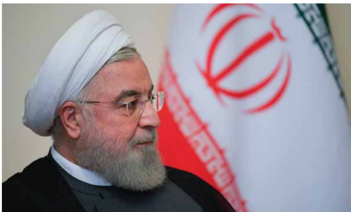
الرئيس الإيراني حسن روحاني

أقادت صحيفة «نيويورك تايمز» بأن دائرة الاستخبارات التابعة لوزارة الدفاع الأميركية كانت تشتري قواعد بيانات معلومات حول مواقع وتحركات الأميركيين دون أمر قضائي. واستندت الصحيفة إلى وثائق تم تقديمها لاستجابة طلب من السيناتور روبرت وايت، وحسب الوثائق، قام موظفو إسرائيل خلال الأشهر الماضية، بما في ذلك البناء على نجاح اتفاقات السلام بين إسرائيل وقل من الإمارات والبحرين والسودان والمغرب.