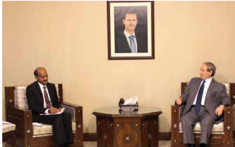
وزير الخارجية والمغتربين فيصل المقداد خلال استقبال سفير الهند في سورية حفظ الرحمن

إلى سورية، كمساهمة منها للتخفيف من آثار الإجراءات القسرية الأحادية الغربية التي تفرضها أميركا ودول حليفة أخرى على الشعب السوري. وبين عباس أن الدفعة الأولى من المساعدات الغذائية انطلقت من الأراضي الهندية، وهي في طريقها إلى سورية، وهذه المساعدات «تسعى من خلالها الحكومة الهندية للتخفيف من معاناة شعبنا جراء الحصار الطائلي الذي تفرضه قوى الاستعمار الجديد على بلدنا».