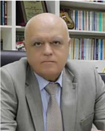
محافظ درعا مروان شريك

في محافظة درعا مروان شريك في تصريحه لـ«الوطن»، ما روخته أسس مصادر إعلامية معارضة، من شفاعت، ابتداءً من اشتباكات عشية في مدينة طفس بريف الحماضفة السورية وحضات من الجيش العربي السوري ومسلّحات مسلحة، مؤكداً أنه «لا اشتباكات»، وأن الأمور تسير نحو التسوية والمصالحة، وقال المصدر درعا: «هناك إجراءات أمنية اتخذت حالياً، ولا يوجد أي اشتباكات، لكن الصلحات المعارضة والمعارضين يتكثرون، مؤكداً أنه لا تعلق أي مشكلة تاريخ حتى هذا التاريخ.