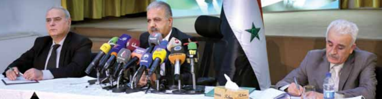
وزير الكهرباء غسان الزامل يتوسط معانعه خلال المؤتمر الصحفي أمس

المجاورة بالكهرباء بين الزامل أنه لا صحة لما يتم تداوله عبر بعض وسائل التواصل الاجتماعي وهذا يتطلب ١٢ شهراً لانتاجها منها بحيث يمكن الحصول من خلالها على ما يزيد على ٤٠٠ ميغا واط بعد أن تم توقيع عقد تأهيل المجموعتين الأولى والخامسة مع شركة من دولة صديقة.