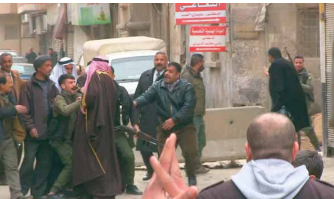
عناصر من ميليشيات «قسد» يستخدمون الرصاص لتفريق تظاهرة ضد تصرفاتهم وحصار مركز مدينة الحسكة