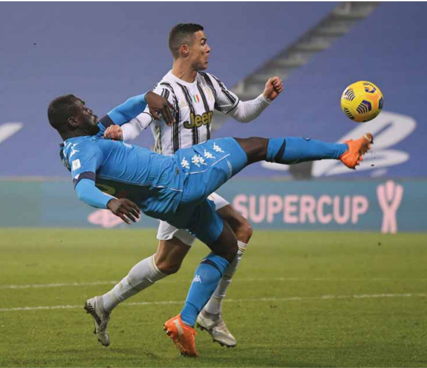
نابولي وقمة الفرصة الأخيرة مع اليوفي

تيم (٤:٠٠)، ليل × بريست (٦:٠٠)، بورдо × مرسيلا (١٠:٠٠).