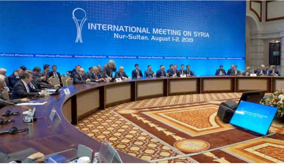
من جولة محادثات «مسار أستانا» سابقة

في نيسان الماضي على مستوى وزراء خارجية الدول الضامنة، من خلال تقنية الفيديو بسبب التدابير الوقائية ضد فيروس «كورونا». وفي كل جولات محادثات أستانا تجدد الدول الضامنة في ختامها تأكيد التزامها القوي بسيادة ووحدة وسلامة أراضي سورية واستمرار التعاون حتى القضاء على التنظيمات الإرهابية فيها ورفض الأجندات الانفصالية التي تهدف إلى تقويض سيادة وسلامة الأراضي السورية.