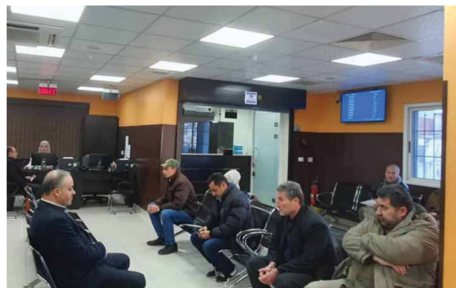
إفادي بك الشريف

كشف مدير مراكز خدمة المواطن في محافظة دمشق لؤي علوش في حديث خاص لـ«الوطن» عن تزويد مراكز الخدمة بشكل تدريجي بمنظمة طاقة شمسية بديلة، موضحاً البدء بـ٤ مراكز في القنوت والميدان ودمر والمزة)، ومن المقرر هذا العام أن تزود ٥ مراكز جديدة بالطاقة البديلة لتشمل مراكز مشروع دمر والمهاجرين وحي ورود المقرر إحدائه وتجهيزه إضافة إلى السجل المؤقت والشام الجديدة.