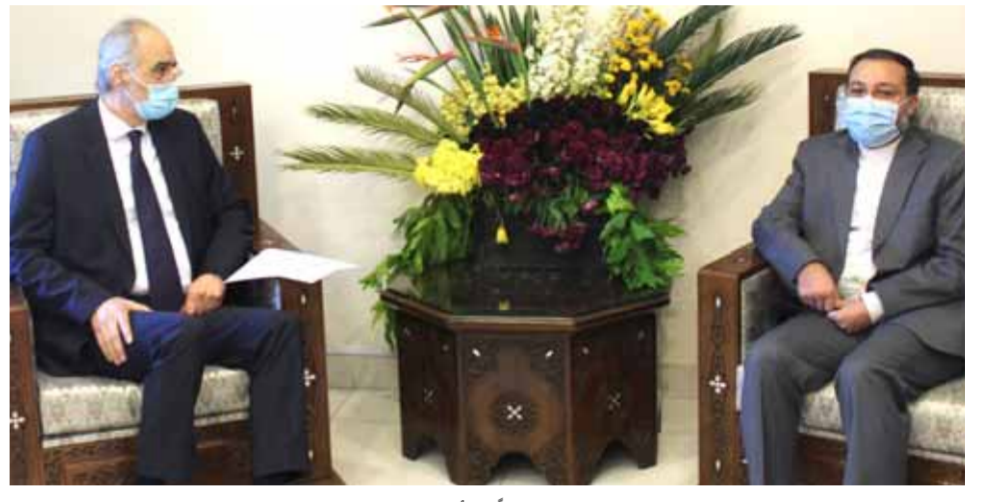
نائب وزير الخارجية والمغتربين بشار الجعفري خلال لقائه وفداً من أساتذة العلوم السياسية في الجامعات الإيرانية

فادي بك الشريف - وكالات أكد نائب وزير الخارجية والمغتربين بشار الجعفري، أهمية التبادل الأكاديمي بين الجامعات السورية والإيرانية وتوظيف الثقافة والأدب في خدمة الدبلوماسية والعمل السياسي. وخلال استقباله أمس وفداً من أساتذة العلوم السياسية في الجامعات الإيرانية، نوه الجعفري بحسب «سانا»، لأهمية الدبلوماسية الشعبية في نقل الصورة الحقيقية للراي العام عن الأوضاع في البلدين. من جهته أكد أعضاء الوفد الإيراني أهمية هذه الزيارة لتعزيز التعاون الأكاديمي والعلمي بين البلدين. الوفد الإيراني زار جامعة دمشق أمس، والتقى رئيسها محمد يسار عابدين، حيث جرى بحث سبل توطيد علاقات التعاون العلمي بين جامعة دمشق والجامعات الإيرانية في مجال العلوم السياسية والاقتصادية والإدارة والحقوق. من خلال التبادل الطلابي والأبحاث العلمية المشتركة وتبادل الأساتذة في الكليات والاختصاصات المتماثلة لدى الجانبين. عابدين وفي تصريح له «الوطن»، بين أنه تم الاتفاق حول الإشراف المشترك على طلاب الدراسات