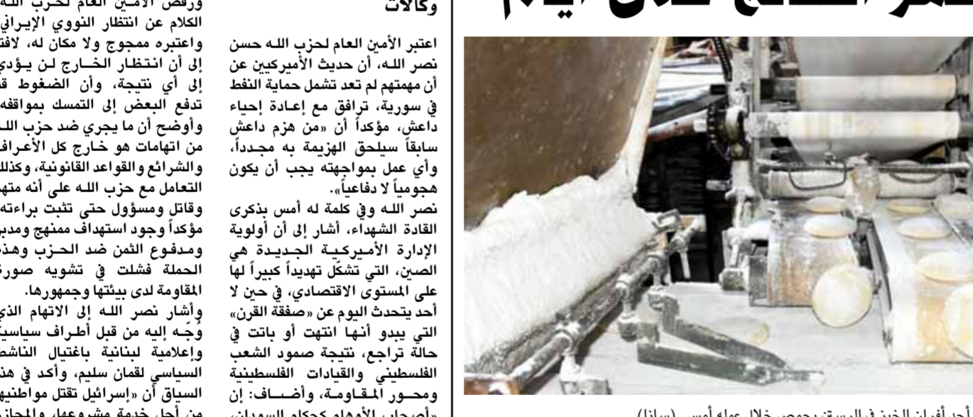
أحد أفران الخبز في الرستن بحمص خلال عمله أمس

هنا غانم أكد مجلس الوزراء على استمرار الجهود لتأمين حاجة البلاد من مادة الطحين والتي تستظهر نتائجها الإيجابية خلال الأيام القليلة القادمة والتشدد بمراقبة الأفران وزيادة منافذ البيع والمعتدين لضمان حصول المواطنين على مخصصاتهم والتخلص من مظاهر الإزدحام. وخلال جلسته أمس برئاسة رئيس المجلس حسين عرنوس شدد المجلس على ضرورة تكاتف جميع الجهود والوجود الميداني للمنعين في الأسواق لضبط الأسعار والتواصل المباشر مع المواطنين وتقديم كل التسهيلات الممكنة لهم في مختلف المجالات. كما ناقش المجلس رؤية وزارتي الزراعة والصناعة لتطوير الواقع الزراعي والصناعات الزراعية وتوفير مستلزمات الإنتاج وصولاً إلى منتجات صناعية غذائية ذات ميزة تنافسية تلبي حاجة السوق المحلية مع تصدير الفائض بما يسهم في تحسين الميزان التجاري. المجلس أكد على ضرورة الأخذ بالملاحظات المطروحة خلال الجلسة ليصار إلى اعتماد الرؤية بصيغتها النهائية ووضع البرامج الزمنية لتنفيذها. وأكد عرنوس خلال الجلسة على أهمية التقييم المستمر أداء