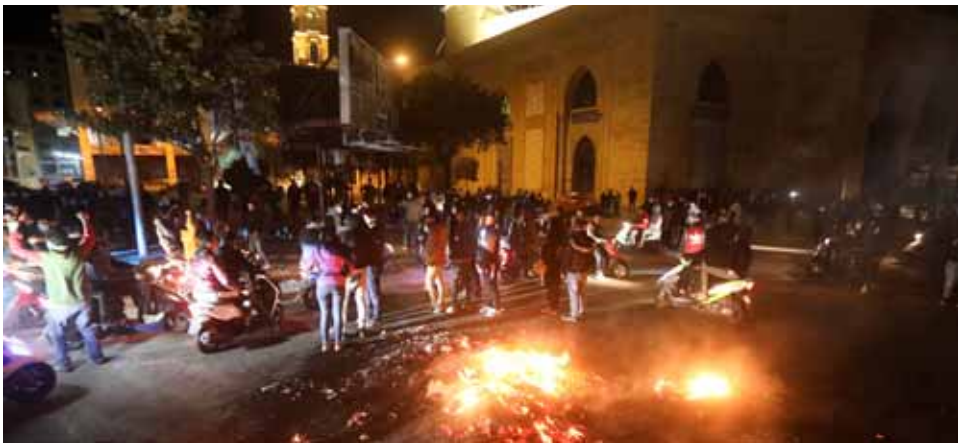
متظاهرون في بيروت يحتجون على انخفاض الليرة اللبنانية وتفاقم الصعوبات الاقتصادية

هذا القطع للطرق حتى ساعة إعداد قطع الطرق، في كل مدن ومخاضات لبنان، وعزل العاصمة بيروت عن بقية المناطق، رأى مراقبون حسب وسائل إعلام لبنانية، بأنها قد تسهم في زيادة نقشي فيروس «كورونا» في البلاد. وارتفع سعر صرف الدولار، مقابل الليرة اللبنانية، في السوق السوداء إلى ١٠ آلاف ليرة للدولار الواحد، بينما لا يزال سعر الصرف الرسمي ١٥٠٠ ليرة لبنانية للدولار. وأقدم عدد من المواطنين على إقفال محال الصيرفة في منطقة شورا في البقاع، احتجاجاً على الارتفاع الجنوني لسعر الصرف، بينما عمد أصحاب المحال التجارية إلى إقفالها.