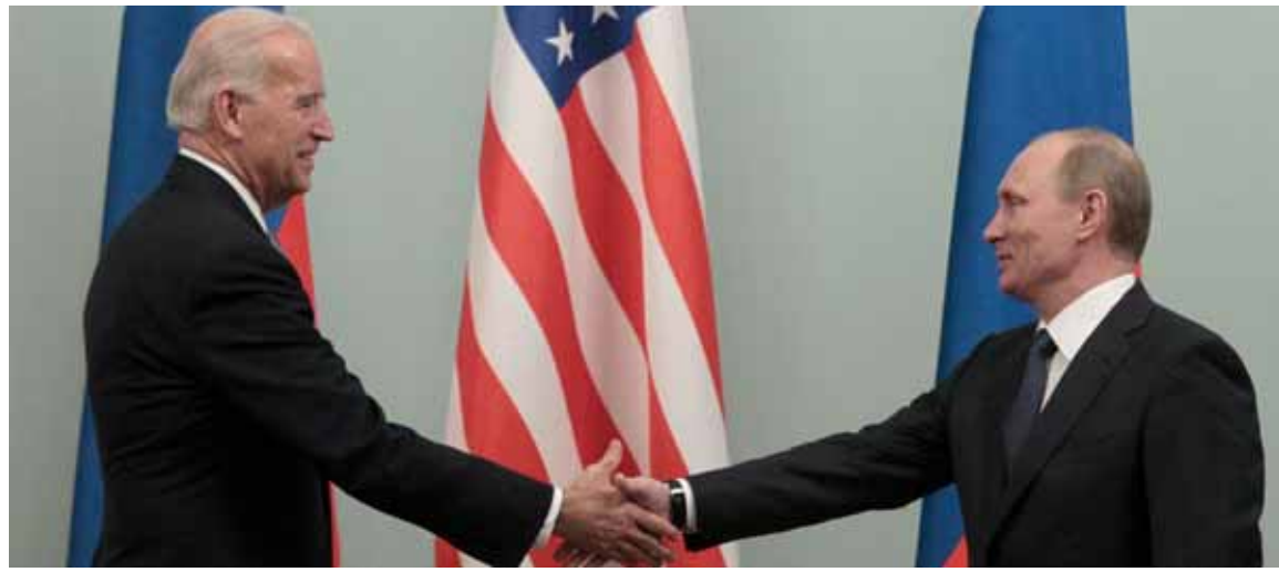
صورة أرشيفية للرئيس الروسي فلاديمير بوتين والرئيس الأميركي جو بايدن في موسكو

ضد روسيا، مشيراً إلى «فرض عقوبات على ٧ مسؤولين روسيين رفيعي المستوى». وأضاف: إن «هناك مؤسسات روسية وألمانية وسويسرية هي ضمن قائمة العقوبات الأميركية على خلفية قضية نافالني». من جهته أعلن وزير الخارجية الأميركي أنتوني بلينكن عن إدراج روسيا على قائمة الدول التي يحظر توريد التكنولوجيا الدفاعية إليها، وذلك مع بعض الاستثناءات في القطاع الفضائي، كما أعلن بلينكن عن حظر تقديم القروض لروسيا من قبل المؤسسات المالية الحكومية الأميركية. الرد الروسي لم يتأخر حيث اعتبرت المتحدثة باسم الخارجية الروسية ماريا زخاروفا، أن قرار العقوبات الأميركي - الأوروبي المشترك «هجوم معاد لروسيا»، وانتصار للعبثية، وقالت: «يحاول البيت الأبيض مرة أخرى، المنورط في مشاكله الداخلية، ترسيخ صورة العدو الخارجي.. لقد علقنا مراراً وتكراراً على هذه السياسة الأميركية التي تخلو من المنطق والمعنى وتؤدي فقط إلى إضعاف العلاقات الثنائية بشكل متزايد، الأمر الذي جعلته واشنطن بالفعل يصل إلى نقطة التحديد الكامل.. وأضافت: «انتصرت العبثية عندما يعلن أن سبب فرض العقوبات هو استفزاز متعمد مع تسميم مزعوم لنافالني بنوع من المواد الكيماوية القاتلة.. كل هذا مجرد ذريعة لمواصلة التدخل المفتوح في شؤوننا الداخلية».