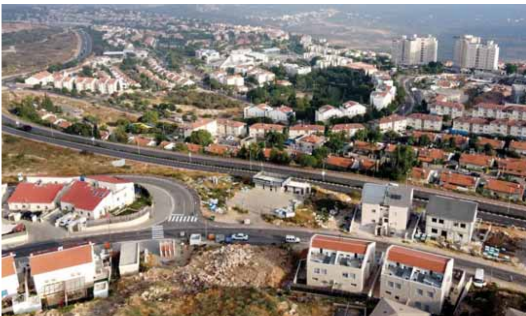
الاحتلال الإسرائيلي مستمر في توسعة المستوطنات في الضفة الغربية المحتلة

وأعلنت السفارة الأميركية لدى الأمم المتحدة، ليلنا نوماس- غرينفيلد، أن واشنطن ستعيد فتح قنوات اتصال دبلوماسية مع فلسطين كانت المتجمدة في وقت سابق، السفارة الأميركية خلال مؤتمر صحفي أمس حول القضية الإسرائيلية- الفلسطينية: إنه منذ كانون الثاني/الغالبات استرشدت ممتنا شكراً للدبلوماسية الفلسطينية، لافتراض أن التقدم الاستدام نحو السلام يجب أن يستند إلى مشاورات نشطة مع الجانبين.