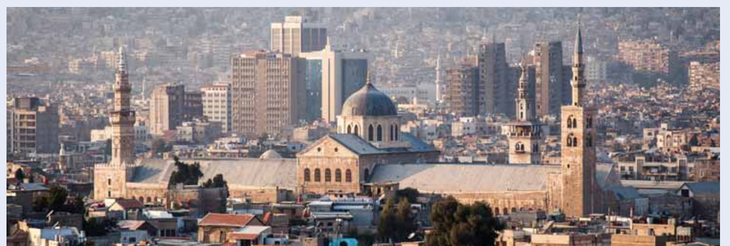
المبادرة تعتبر أن الشرق الأوسط يتمتع بنظام سياسي واقتصادي نابع من تاريخ الحضارة الغريدة (من الانترنت)

حصلت «الوطن»، على تفاصيل المبادرة التي أطلقتها الصين بخصوص تحقيق الأمن والاستقرار في الشرق الأوسط، وأكدت أن «حسن قطار» وساء في مقعدة المبادرة أنه يمثل «الروح القدس» إضافةً إلى الشرق الأوسط. وفي منطقة الشرق الأوسط، من بينها قضايا خطيرة تؤثر في الأمن والاستقرار العالميين، يجب على المجتمع الدولي التصرف على بنيتها الجهادية. ولأنها أساليب مختلفة كصاحب مصلحة، القيام بدور إيجابي في تدعيم الأمن والاستقرار في الشرق الأوسط. وفي هذا السياق حرص الجانب الصيني على طرح مبادرته بشأن تحقيق الأمن والاستقرار في منطقة الشرق الأوسط.