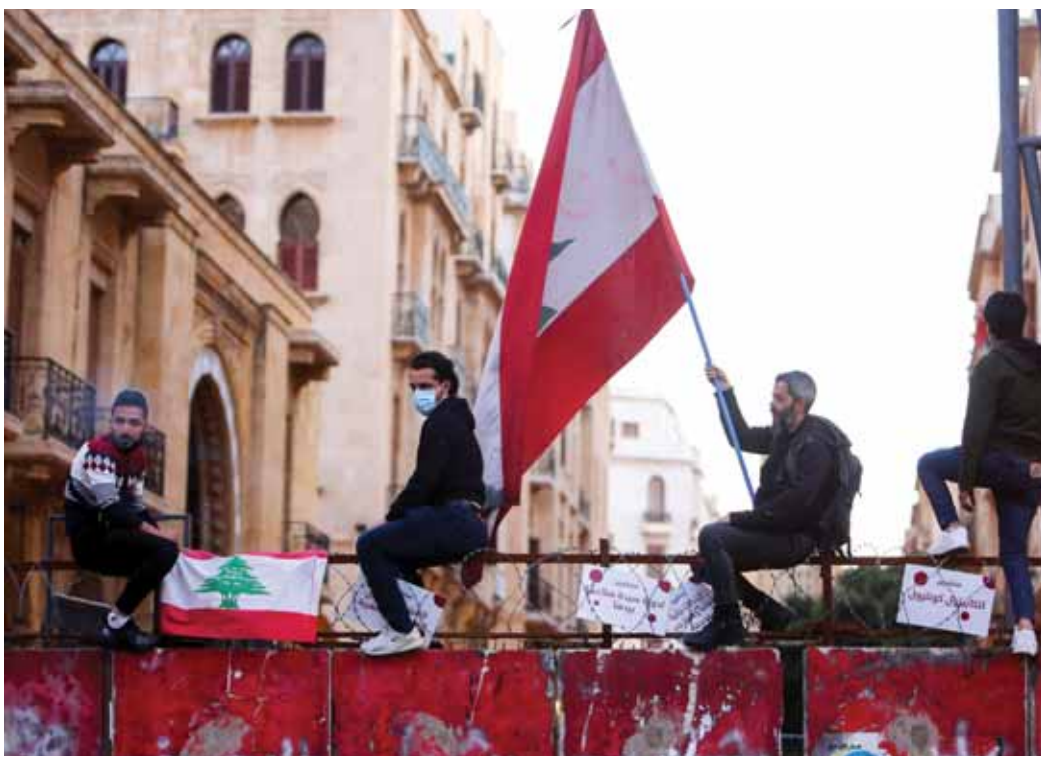
متظاهرين في بيروت خلال احتجاج على هبوط العملة اللبنانية وتزايد الصعوبات الاقتصادية (رويتزر - أريفي)

كالتق في تعامله مع رئيس الجمهورية ومع الكتل البرلمانية المعنية، ويرى في هذا السلوك رغبة واضحة في أن يسمى بنفسه الوزراء المسجونين فيكون له نصف أعضاء الحكومة وحسب صحيفة «الإخبار» فإن سفيرتي الولايات المتحدة والأميركية وفرنسا قد أبلغتا الحريري بأن الرئيس عون يعتقد ببقاء أي فرصة للتوافق والاتفاق معه على تأليف حكومة جديدة، ويأتى ذلك ضمن في تسمية رئيس الوزراء وحسب الصحيفة فإن الدبلوماسيين المؤثرين في المشهد الحكومي في المدى المنظور، مشيرة إلى أن السعي الأوروبي، وتحديداً الفرنسي، والضغوط المراسية على القوى السياسية لإنجاح التسمية، تضغط بعدم الجهورية الأميركية لئلا يتباطأ البيت الأبيض، وخصوصاً أنه ليس أولوية على طاوله البيت الأبيض، حسب تعبيره.