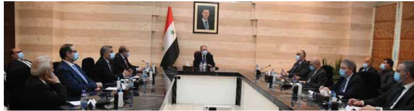
.. وخلال اجتماعه مع مجلس إدارة اتحاد غرف التجارة السورية (عن الانترنت)

الشهابي بين من الإجراءات التي تم طرحها خلال الاجتماع أن المناطق المتضررة بحاجة إلى محفزات، ويجب تشميل المناطق التي تم نهيبها وتميرها بقانون الاستثمار. إضافة إلى أن دعم التصدير يجب أن يكون نقداً وبسرعة. وشدد على ضرورة سد الثغرات التي يتسرب منها الدولار وأهمها البيوع العقارية الكبيرة التي تهرب أموالها إلى الخارج والمعاير التي يهرب عبرها الدولار لشراء المهربات التركية.