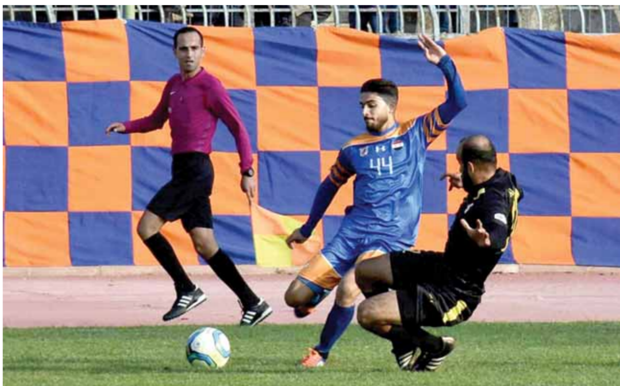
من فوز الكرامة على الساحل ذهاباً

الساحل بخسارته القاسية أمام حرجلة بات وضعه أكثر حرجاً من قبل، الخسارة جدد ذاتها لم تكن مزعجة بقدر الشعور بعجز الفريق عن تحقيق نتيجة طيبة في المباريات القادمة حسب الأداء والمستوى الذي يقدمه الفريق، فمن أصل ١٥ نقطة ممكنة لم يحقق الساحل