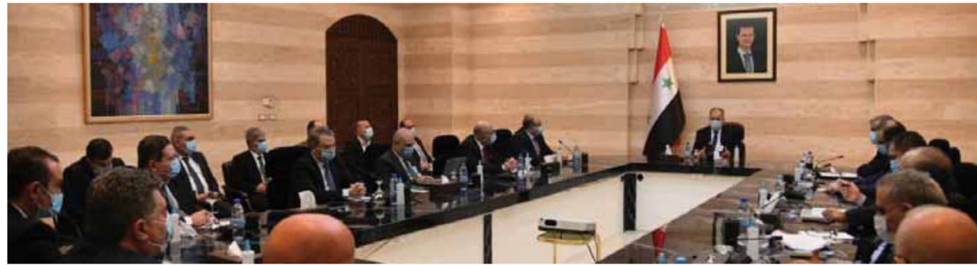
رئيس مجلس الوزراء حسين عرنوس خلال اجتماعه مع مجلس إدارة اتحاد غرف الصناعة السورية

وتناولت الطروحات تطوير التشريع الضريبي ودعم التبادل التجاري مع الدول الصديقة والإسراع باستصدار قانون الاستثمار وتقديم التسهيلات لإعادة تأهيل العامل المتضرر من الإرباب وتوفير حوامل الطاقة اللازمة للإنتاج الصناعي والتأكد على الاستثمار باقتصاد الاستيراد على مستلزمات الإنتاج وتشجيع الصناعات التصديرية وتقديم