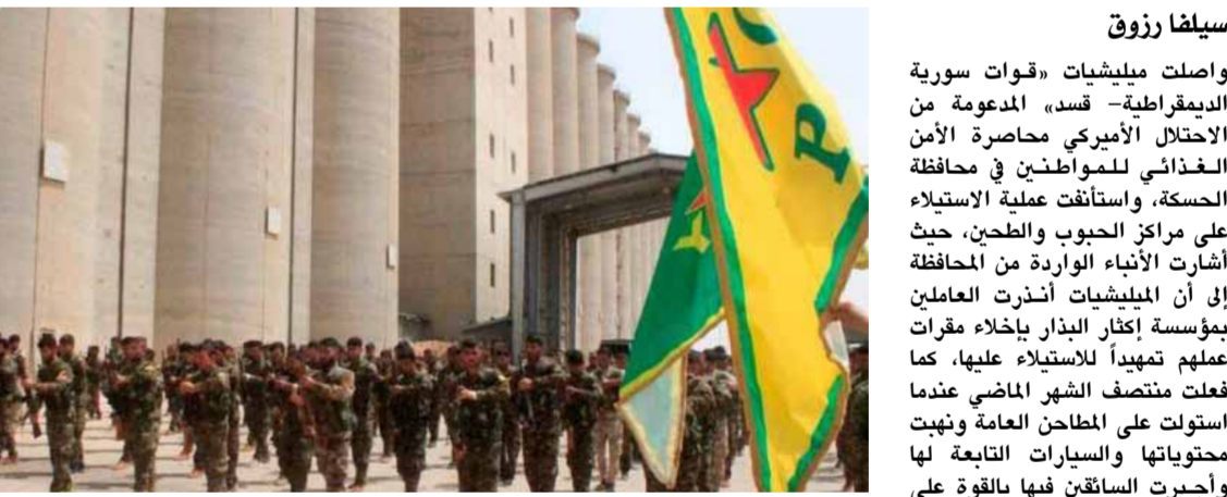
مليشيات «قصد» تحول صوامع الحسكة إلى مسكرات تجنيد

سليفا رزوق واصلت مليشيات «قوات سورية الديمقراطية - قسد» المدعومة من الاحتلال الأمريكي محاصرة الأمن الغذائي للمواطنين في محافظة الحسكة، واستأنفت عملية الاستيلاء على مراكز الجيوب والطحين، حيث أشارت الأنباء الواردة من المحافظة إلى أن المليشيات أذرت العاملين بمؤسسة إكثار البذار بإخلاء مقرات عملهم تهديداً للاستيلاء عليها، كما فعلت منتصف الشهر الماضي عندما استولت على المطاحن العامة ونهبت محتوياتها والسيارات التابعة لها وأجبرت السائقين فيها بالقوة على العمل بامرئها. محافظ الحسكة غسان خليل أكد في تصريح لـ«الوطن»، أن موضوع حصار الأمن الغذائي في الحسكة قديم ويبدأ منذ سنوات، حيث جرى الاستيلاء على محاصيل القمح، وعلى صوامع القمح، والآن جرى الاستيلاء على المطاحن والأفران ومحاصرته السوريين في محافظة الحسكة برغيف خبزهم اليومي، وحبية القمح التي تدخل إلى الداخل السوري، والتي نحن بأبسط الحاجة إليها وتقوم الدولة باستيرادها لتزود بها المواطن في سورية. ولفت خليل إلى الاعتداءات التي جرت بحق مخازن الأعلاف، واليوم هناك حصار مؤسدة إكثار البذار،