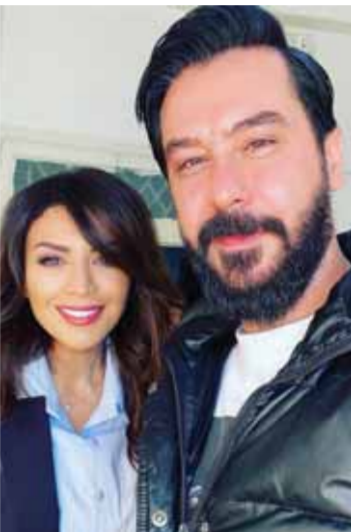
ميلاد يوسف وأمل بوشوشة

وكانت قد نشرت مقطع فيديو للرد على الشائعات المتداولة حول دخولها العناية المركزة وارتدائها الحجاب، وعلقت على الفيديو قائلة: «سواء اللق من مصر أم الدنيا، عايزة أقولكم أنا لابسة كده من البرد على فكرة، عشان تبتلوا الإشاعات، حاجة إشعاش وحاجة حجاب إلا إذا أراد ربنا».