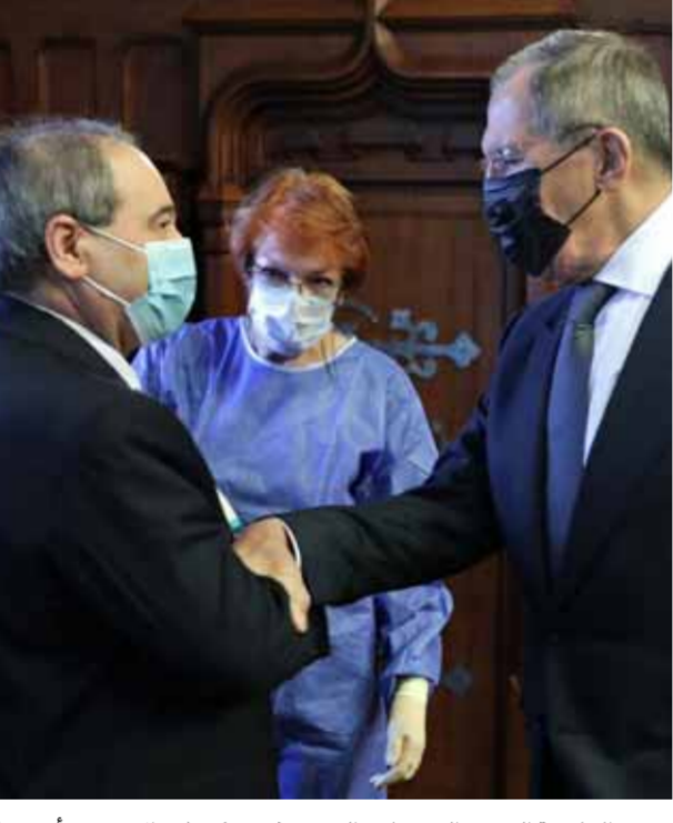
وزير الخارجية الروسي التي نظيره السوري في موسكو

للجنة مناقشة الدستور، حيث كانت وجهات النظر متفككة لجهة عمل اللجنة بقيادة وملكية سورية، ودون أي تدخل خارجي أو جداول زمنية مفروضة عليها من الخارج من أي جهة كانت، وانتقفا على الاستمرار بالتشاور والتنسيق بينهما حول مختلف التطورات. الخارجية الروسية وفي بيان لها أشارت إلى أن الوزيرين «بحفا الوضع في سورية، وحولها، مع التركيز على تفعيل التسوية السياسية عبر الحوار الوطني ودون أي تدخل خارجي»، وأضاف البيان: إن الجانبين ناشيا «التحضير للدورة السادسة للجنة الدستورية السورية في جنيف، حيث أكد الجانب الروسي ضرورة العمل بالحديث لتنسيق الإصلاح الدستوري». وأكدت روسيا حسب البيان تمسكها بالعمل المشترك مع تركيا وإيران ضمن «صيغة أستانا» بهدف تحقيق ما ينص عليه قرار مجلس الأمن الدولي رقم ٢٢٥٤، بما في ذلك ضمان سيادة وسلامة أراضي واستقلال الجمهورية العربية السورية، كما جرى التأكيد على «مواصلة محاربة التشكيلات الإرهابية بحزم، وكذلك التصدي لحاولات القوى الخارجية لتسجيع التوجهات الانفصالية على الأراضي السورية».