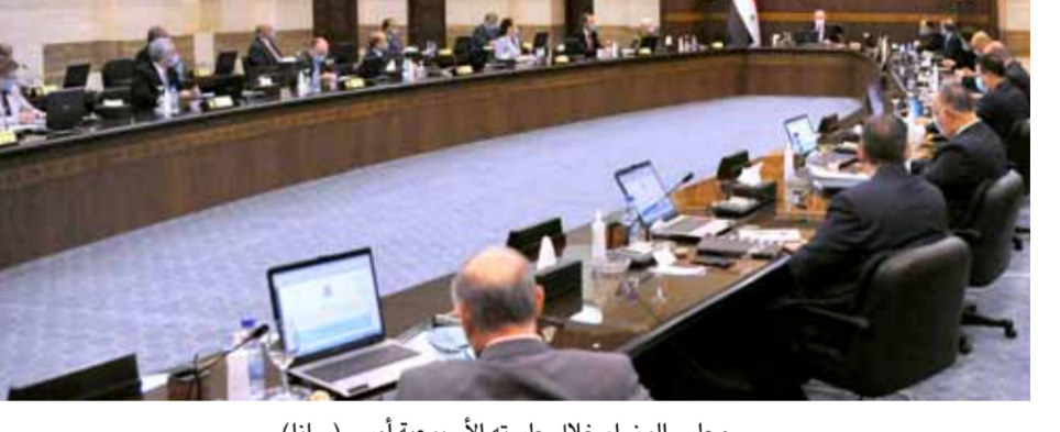
مجلس الوزراء خلال جلسته الأسبوعية أمس

عبر البطاقة الإلكترونية على مستوى المحافظات ومدى مساهمتها في إيصال الدعم لمستحقيه وتحقيق العدالة والمرونة في عملية التوزيع، وتم الطلب من الوزارات المعنية استكمال قاعدة البيانات حول هذه التجربة ليصار إلى دراستها بشكل دقيق والوصول إلى مقترحات قابلة للتطبيق وتلافي الثغرات. وأكد المجلس على أولوية استمرار ودعم القطاع الصحي وتقديم المحفزات للكوادر الطبية وتطوير خبراتها وتحسين الخدمات المقدمة للمواطنين وتأمين الاحتياجات المحلية من الأدوية. وطالب من الوزارات التشدد بتطبيق الإجراءات الاحترازية المتخذة