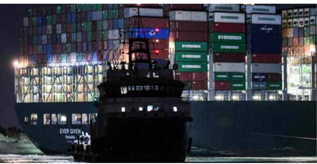
صورة ليلية لسفينة «إيفرغيفن» الجانحة في قناة السويس

حتى 30 بالمئة، ويعد خياراً أفضل كبدل عن قناة السويس في مجال الترانزيت»، وتابع: «الحادث الأخير يعتبر مؤشراً على ضرورة البحث عن بديل أقل خطورة من قناة السويس، التي تعبر منها أكثر من مليار طن من السلع سنوياً». وحسب وسائل الإعلام، فإن «الخط يبدأ من الهند وصولاً إلى ميناء «جابهار» الواقع جنوب إيران على المحيط الهندي، ثم شحن البضائع براً وصولاً إلى ميناء «بندر انزلي» شمالي إيران على ساحل بحر قزوين».