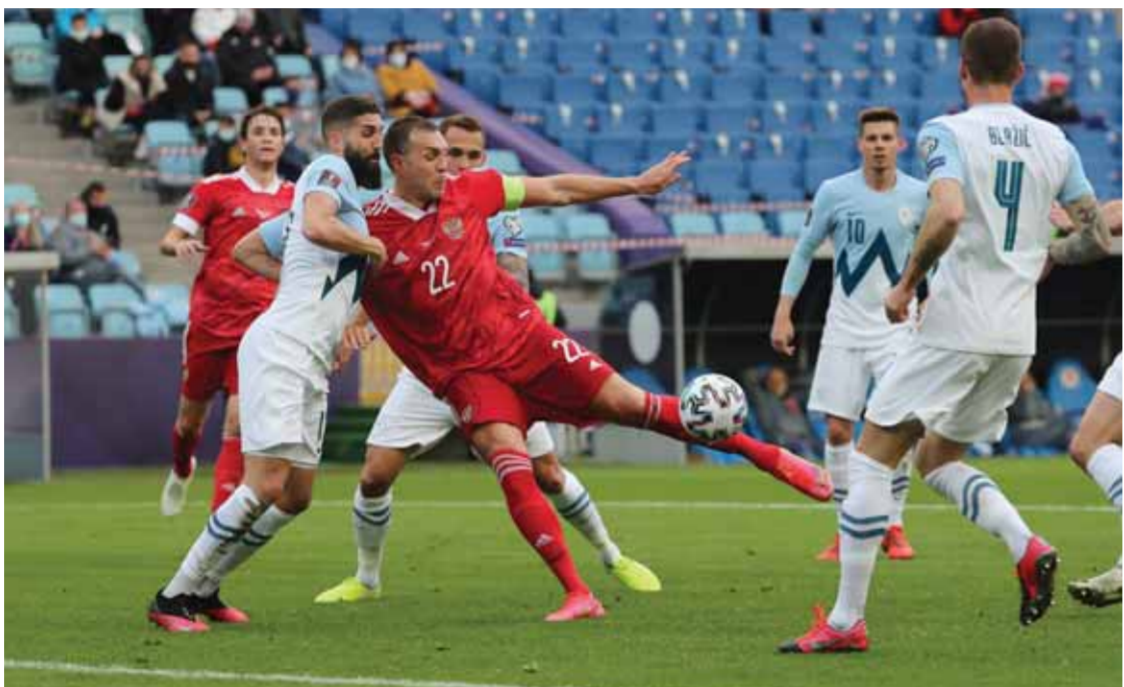
دزويبا قاد الفوز وصدارة المجموعة الثامنة

إلى جانب خمسة لاعبين آخرين في صدارة الهادفين حتى نهاية مباريات السبت، ورفع رصيده إلى ٢٩ هدفاً على العموم ليصبح اللروس الكسندر كراخوف المعتزل عام ٢٠١٦، وكان دزويبا سجل ٨ أهداف لمنتخب بلاده في تصفيات يورو ٢٠٢٠ فقصده فريقه المجموعة الثامنة بـ٦ نقاط أمام سلوفينيا وكرواتيا، من جهته استعاد الأخير وصيف بطل العالم توازنه بفوز أول وإن جاء ضعفاً على حساب قبرص بهدف يتيم سجله ماريو بازليتش لاعب تلاتنا الإيطالي وهو الأول رسمياً يقمص النادي بعد ٢٢ مباراة دولية وسبق له أن سجل هدفين ودياً في العام الماضي، وسبق للفريق الكرواتي أن خسرت افتتاحاً أمام سلوفينيا.