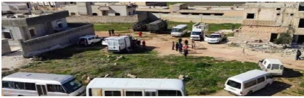
جانب من الاستعدادات عند معبر ترثية

سكان إدلب على التظاهر للتفديت بافتتاح المعابر. ورغم أن نائب رئيس مركز التنسيق الروسي اللواء البحري ألكسندر فاديميتشيف كاربوف غير في تصريح له «الوطن» قبل أيام عن قلقه بأن الجانب التركي سوف يشارك بإعادة فتح المعابر في منطقتي إدلب وحلب اتفاق موسكو بعد عام على توقيعها، واصل سياسة اللب على الجانب السياسي والتصل من أي تقام يتوصل إليه مع الجانب الروسي، والتي شكل موضوع المعابر في محافظتي إدلب وحلب أحد آخرها. وبعد إعلان وزارة الدفاع الروسية عن توصلها إلى اتفاق مع الجانب التركي لإعادة فتح المعابر مع معبر ميزناز بريف حلب الغربي، نفى مسؤولون أتراك ومنظمو ميليشيات تمويلهم أنقرة الإعلام الرسمية التركية حتى أس عن تأكيد المشاورات مع موسكو حول الموضوع ونتائجها المربحة. وأفادت مصادر محلية في سراقب لـ«الوطن»، بأن «جبهة النصرة» والميليشيات الموالية للنظام التركي منعوا الأهالي من التوجه إلى معبر ترثية لليوم الرابع على التوالي، أمس، في حين ظل المعبر مفتوحاً من جهة مناطق الحكومة السورية الآمنة، حيث تناوب وسائل نقل وسيارات إسعاف عند المعبر على مدار اليوم لاستقبال الأهالي الراغبين بالانتقال إليها. وأكدت مصادر أهلية في بلدة سمرين، المقابلة لمعبر ترثية، بأن السواتر الترابية ما زالت قائمة على الطريق الذي يصل البلدة بالمعبر لمنع السكان والسيارات من عبوره إلى مناطق الدولة السورية الآمنة مع إغلاق الطرق الترابية المؤدية إلى سمرين وبلدة الترثية للغاية ذاتها.