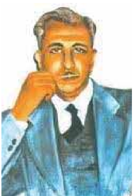
خير الدين الزركلي