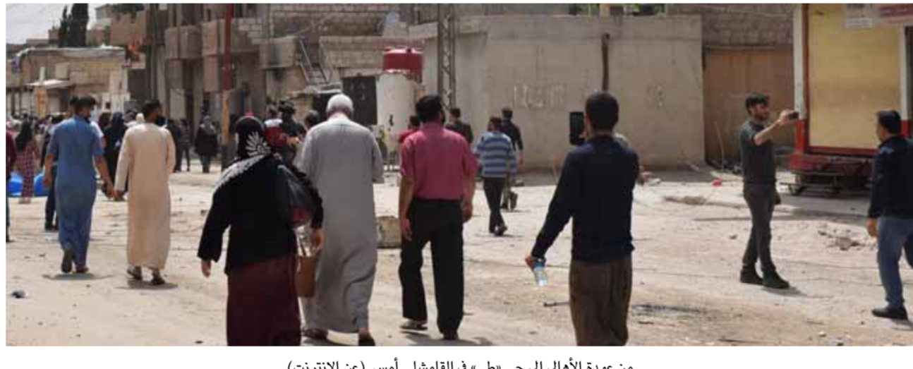
من عودة الأهالي إلى حي طي في القامشلي أمس