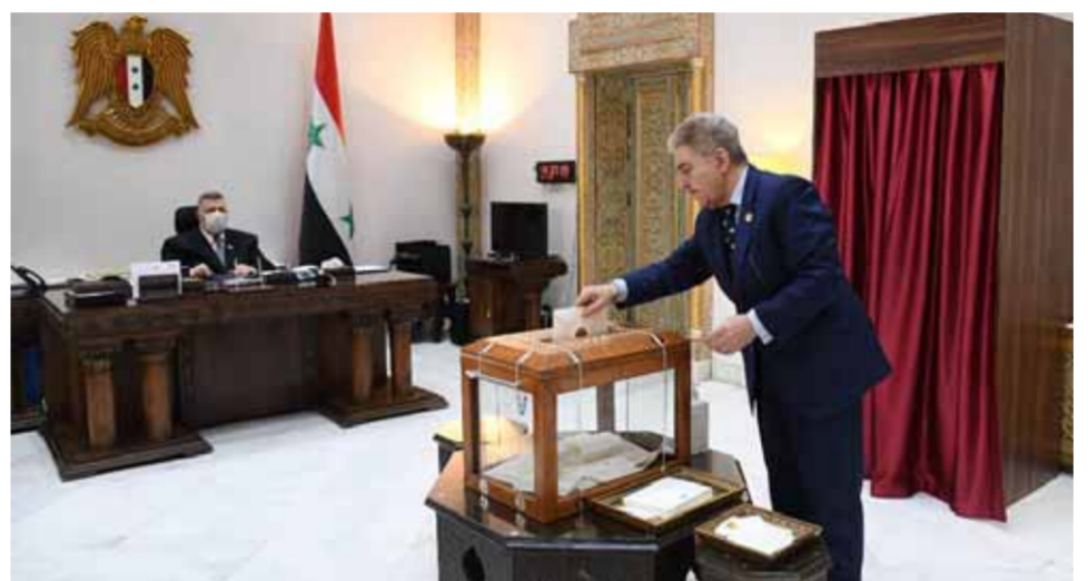
أعضاء مجلس الشعب يواصلون إعطاء تأييداتهم الخطية لمرشحيهم في الانتخابات الرئاسية