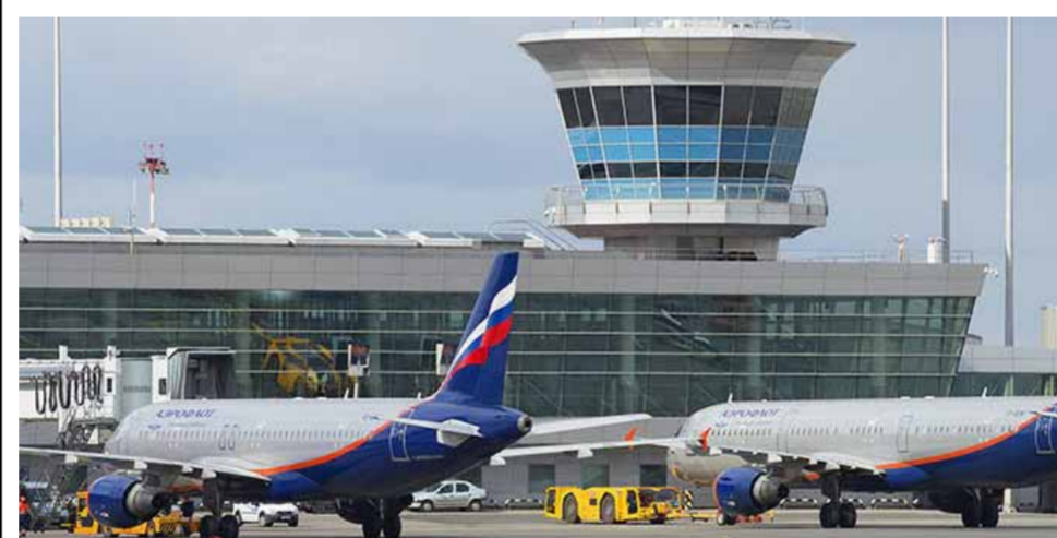
مطار موسكو الدولي

فيما يتعلق بالنطاقين باللغة الروسية الذين يعيشون جنوب شرقي أوكرانيا، موضحاً أنه لا أحد سيقبل باحتمالية اندلاع حرب أهلية هناك. ورغم نفي الكرملين وجود أي رابط بين قرار تقييد الطيران مع تركيا وموقف موسكو في الأزمة الأوكرانية، غير أن تصريحات وزير الخارجية الروسي التي أدلى بها أمس من القاهرة، كشفت حجم الانزعاج الروسي من الموقف التركي، حيث حذّر لافروف النظام التركي وأطرافاً أخرى من مغبة تشجيع النزعات العدوانية