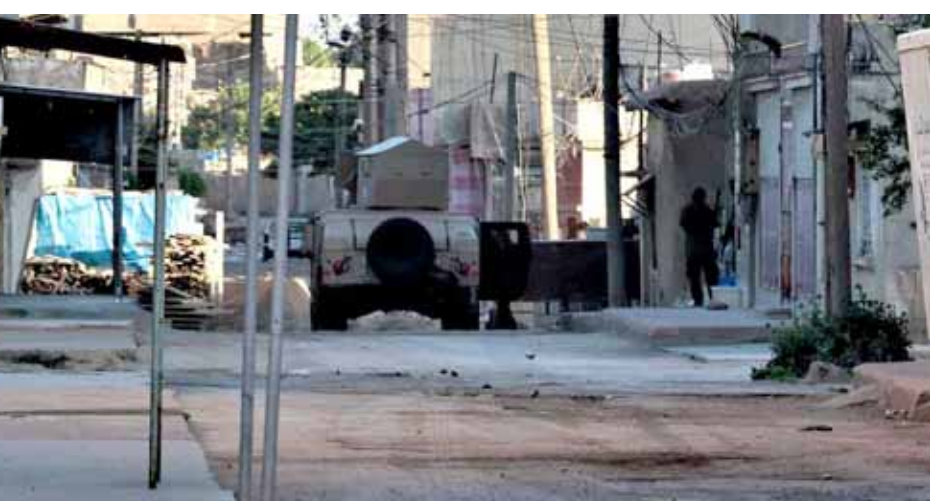
عناصر من ميليشيات «قسد» داخل حي «طي» في القامشلي

سليفا زروق كشف محافظ الحسكة غسان خليل عن التوصل إلى اتفاق بين الوسط الروسي وميليشيات «قسد»، يفضي بخروج هذه الميليشيات من حي طي وعودة الأهالي إلى منازلهم ودخول قوى الأمن الداخلي إلى الحي وعودته للوضع الذي كان عليه قبل احتلاله من قبل هذه الميليشيات. وفي تصريح لـ«الوطن»، بين خليل أن الوضع القائم في القامشلي هادئ، لافتاً إلى أنه حصلت عدة اجتماعات بين الأضواء الروس وأطراف ميليشيات «قسد»، التي تقضت جميع الاتفاقات التي جرى التوصل إليها، كاشفاً أن المعلومات الواردة عن اجتماع جرى مساء أمس، تؤكد أن الميليشيات ستغادر هذه المرة الاتفاق الذي تم التوصل إليه مع الوسط الروسي وفقاً للشروط التي وضعتها الدولة السورية. محافظ الحسكة شدد على أن العبوة التي للتوصل إلى أي اتفاق هي بالتنفيذ، كاشفاً أن الاتفاق ينفذ بخروج الميليشيات من حي طي وعودة الأهالي لبيوتهم ودخول قوى الأمن الداخلي إلى الحي، حيث سيبدأ تنفيذ الاتفاق في الساعة العاشرة من صباح (اليوم) الإثنين، معبراً عن أمه بتنفيذ هذا الاتفاق، لافتاً إلى أن هذه الميليشيات عودتنا أنه ليس لديها ميثاق، لكن