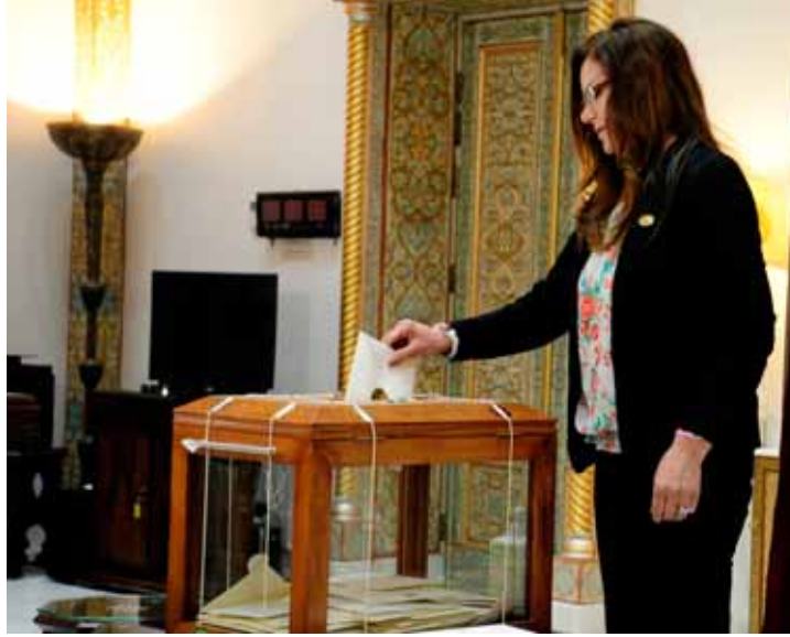
أعضاء مجلس الشعب يواصلون إعطاء تأييدهم الخفية لمرشحيهم في الانتخابات الرئاسية