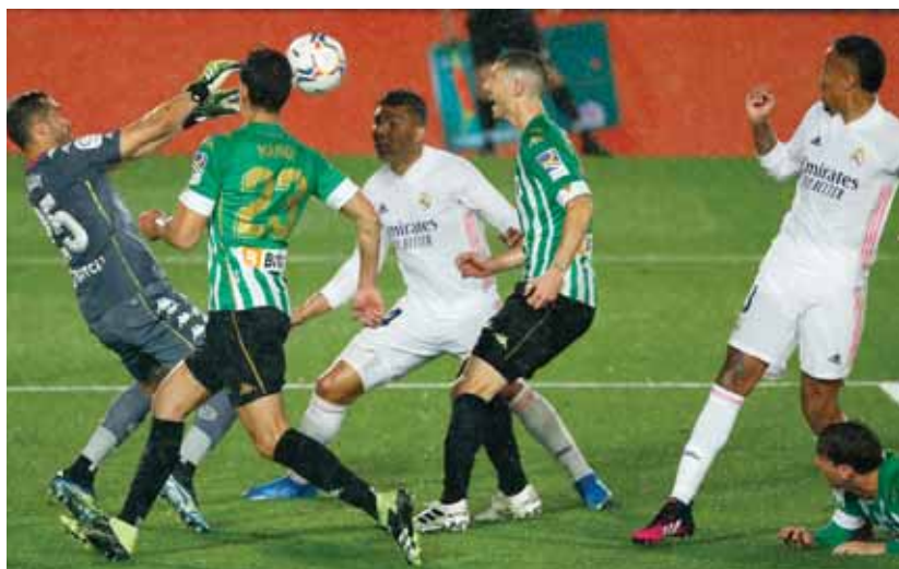
برافو ودفاعه أجبروا الريال على التعادل

استوتون فيلا مع بروميتش على حين اتتهت المبارتان المتكرتان وفق التالي: وولفرهامبتون × بيرلني صفر/٤، لينز × مان يونايتد صفر/صفر. واليوم يلتقي بداية مع العاشرة ليست مع كريستال بالاس في ختام المرحلة الثالثة والثلاثين. من جهة أخرى جرت أمس المباراة النهائية لمسابقة كأس الرابطة الإنكليزية المحترقة بين مانشستر سيتي وتوتنهام على أرضية ملعب ويمبلي في العاصمة لندن وأسفرت عن تتويج سيتي في نصف نهائي الثامنة بفوزه ١/صفر.