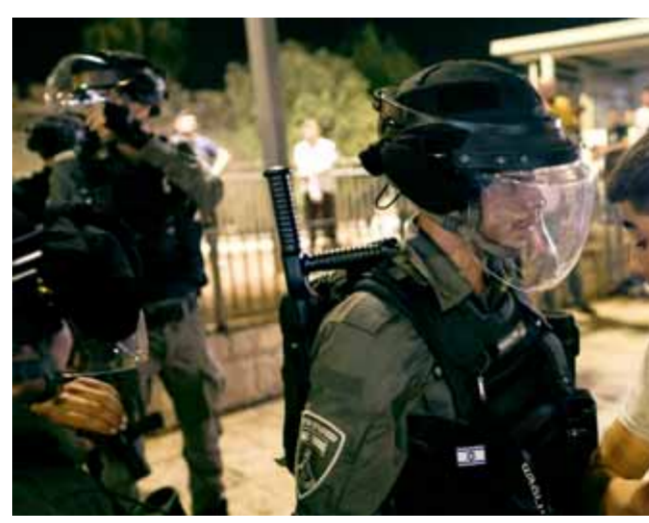
شرطة الاحتلال الإسرائيلي تمنع شاباً فلسطينياً من دخول البلدة القديمة في القدس