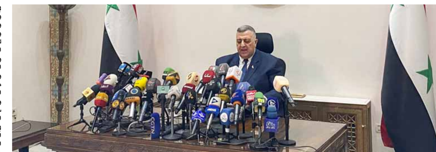
رئيس مجلس الشعب حمود صياغ يعلن نتائج الانتخابات

الوطن أعلن رئيس مجلس الشعب حمود صياغ فوز بشار حافظ الأسد بولاية رئاسية جديدة تحت إشراف سبع سنوات بحصوله على الأغلبية المطلقة بنسبة ٩٥,١ بالمئة من عدد المقيرين السوريين الذين بلغ عددهم أكثر من ١٤ مليون مقترح من أصل أكثر من ١٨ مليوناً ممن يحق لهم الانتخاب داخل سورية وخارجها. وخلال مؤتمر صحفي عقده قبل إعلان نتائج الانتخابات برئاسة الجمهورية قال صياغ: حصل المرشح بشار حافظ الأسد على ١٣٥٤٠٨٦٠ صوتاً بنسبة ٩٥,١ بالمئة في حين بلغ عدد الأصوات التي حصلت عليها المرشحة محمود أحمد مرعي ٤٧٠٢٧٦ صوتاً بنسبة ٣,٣ بالمئة على حين حصل المرشح عبد الله سلوم عبد الله على ٢١٣٩٧٨ صوتاً بنسبة ١,٥ بالمئة من إجمالي أصوات المقيرين. وأضاف صياغ: بناء على ما تقدم وبموجب أحكام المادة ٨٦ من الدستور، ونظراً من أجله من المادة ٧٩ من قانون الانتخابات العامة ونظراً لحصول المرشح الأول بشار بن حافظ الأسد على الأغلبية المطلقة من عدد أصوات المقيرين بنسبة ٩٥,١ بالمئة بسري وبشرطي أن أعلن فوزه بمنصب رئيس الجمهورية العربية السورية. وأكد صياغ أنه بعد عقد المقيرين السوريين في الداخل والخارج ١٤٢٣٩١٤ مقترعاً من أصل ١٨١٠٧١٠٩ مواطنين ممن يحق لهم الانتخاب داخل سورية وخارجها