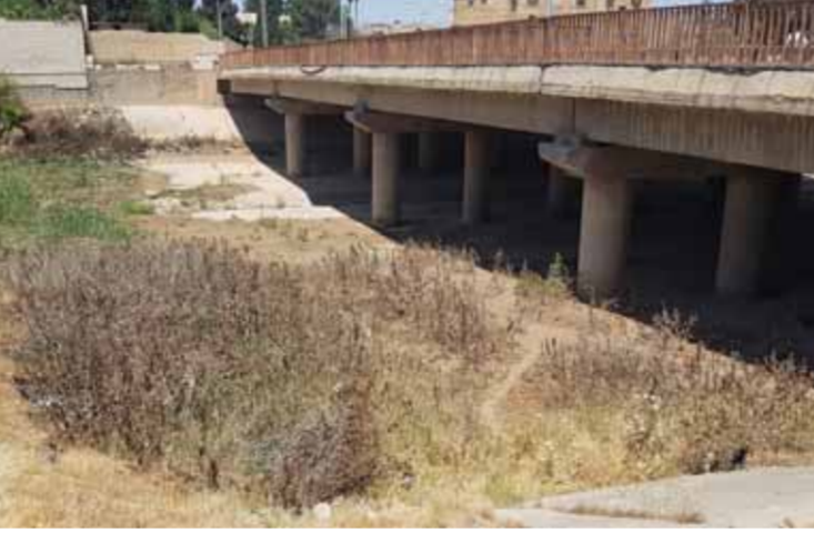
جفاف نهر الفرات نتيجة سطر الاحتلال التركي المتواصل على حصة سورية من المياه (سانا)

تتغذى بالطاقة الكهربائية من خط سد الفرات بالطبقة، الذي يغذي المحافظة بنحو ٨٠ إلى ٩٠ ميغاواط، والمصدر الثاني من محطة توليد السويديّة ذات العتقات الغازية، والتي تغذي المحافظة بنحو ٤٠ إلى ٥٠ ميغاواط، ومؤخراً وبعد اعتداء النظام التركي على مياه الفرات توقفت عتقات التوليد في سد الفرات، وأدى ذلك إلى انخفاض الطاقة الكهربائية، وبالتالي حرمان المحافظة من الكهرباء وذلك لليوم الخامس على التوالي. وأشار عكلة إلى أن الشركة تقوم حالياً بتغذية خطوط الخدمة المستنفة في المحافظة وهي «مضخات المياه والمشافي والأفران والمطاحن» من الكميات المنتجة في منشأة توليد السويديّة. وبين عكلة أن عرق النظام التركي لاتفاقيات الدولية أضر على عملية سقاية الأراضي الزراعية وتسبب بجفاف نهر الخابور الذي يشكل مصدر المياه الرئيس للري في محافظة الحسكة، الأمر الذي انعكس على الواقع الزراعي والخمي بشكل مباشر وقص الكثير من المساحات الزراعية. ويصص بروتوكول تقاسم مياه الفرات الموقع مع الجانب التركي عام ١٩٨٧ على ألا يقل الوارد المائي في نهر الفرات من تركيا إلى سورية عن ٥٠٠ متر مكعب في الثانية تم تخصيص ٥٨ بالمائة منها لتكون حصة العراق وفق اتفاقية ثنائية بين دمشق وبغداد تم توقيعها عام ١٩٨٩.