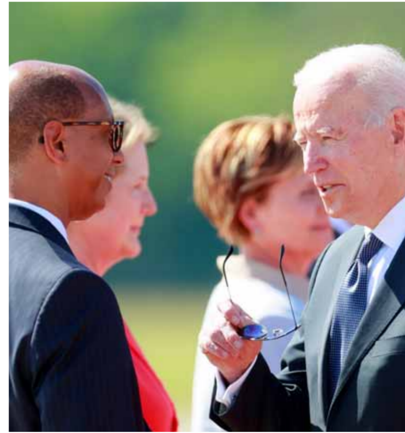
الرئيس الأميركي جو بايدن لدى وصوله إلى جنيف

عن بايدن وبوتين وزير الخارجية الأميركي أنتوني بلينكن، والروسي سيرغي لافروف، إضافة إلى مترجمين، وقبل بدء هذا الجانب من الاجتماعات يسمح للصحفيين بالدخول إلى القاعة لإجراء تصوير بروتوكولي، وأضاف: «الاجتماع الموسع سيجري بمشاركة مسؤولين آخرين من قبل كل من الطرفين». وسبق أن أعلن بيوري أوشاكوف، نائب الرئيس الروسي، أن المحادثات يتوقع أن تركز على بحث «القضايا التي تمثل مباحث إزعاج مشترك في العلاقات الثنائية»، موضحاً أن الزعيمين سيناقشان مواضيع الاستقرار الاستراتيجي ومكافحة جائحة عدوى فيروس كورونا «كوفيد ١٩» والجريمة السيبرانية والمقاتلة الإقليمية مثل الأزمة الأوكرانية والأوضاع في الشرق الأوسط والنزاع الأذربيجاني-الارمني في قره باغ. الرئيس الأميركي يلقي بوتين عقب حضوره سلسلة من القمم كان آخرها قمة «الاتحاد الأوروبي-الولايات المتحدة»، التي استضافتها بروكسل، حيث أعلنت رئيسة المفوضية الأوروبية أورسولا فون دير لاين، عن تطلع الاتحاد الأوروبي والولايات المتحدة إلى بناء علاقات أكثر قابلية للتنبؤ مع روسيا. من جهته كشف الاتحاد الأوروبي في بيان له عقب القمة، بأنه يخطط مع الولايات المتحدة لإقامة «حوار رفيع المستوى» بينهما لتسويق جهود الطرفين في مواجهة ما سماه «أنشطة روسيا الخبيثة»، وقال البيان: «نحن متحدون في موقفنا المبدئي إزاء روسيا، ومستعدون للرد بحزم على تصرفاتها المنطوية السلبية وأنشطتها الخبيثة، ومن أجل تنسيق سياساتنا وخطواتنا نخطط لتنظيم حوار رفيع المستوى بين الاتحاد الأوروبي والولايات المتحدة حول روسيا».