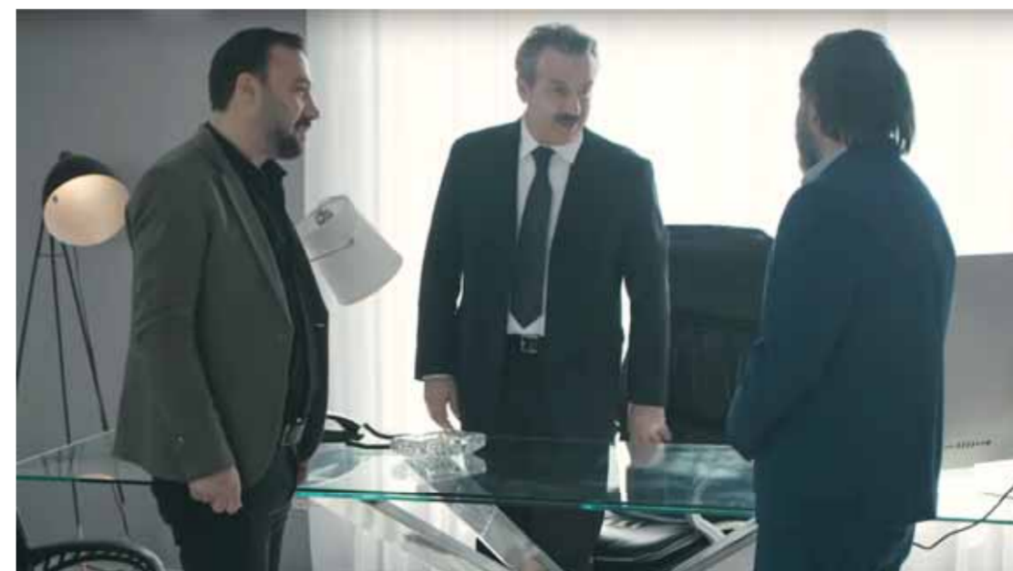
من مسلسل «على صفيح ساخن»

مشاركات عديدة في أعمال البيئة الشامية، ما الذي يجذبك في أعمال البيئة التي قد تنمط الفنان؟ خلال مسيرتي الفنية قمت بتقديم عدة أدوار فنية متنوعة بين الدرامي والبيئية الشامية، لكن لاحظت أن أغلب المتابعين في يفضلون مشاركتي في هذه الأعمال، وعندما يريدون التحدث إلي يختارون أسماء شخصياتي في البيئة الشامية، وأريد أن أوضح أمراً أن العمل في البيئة الشامية متعب لكنه مفر وجموره واسع.