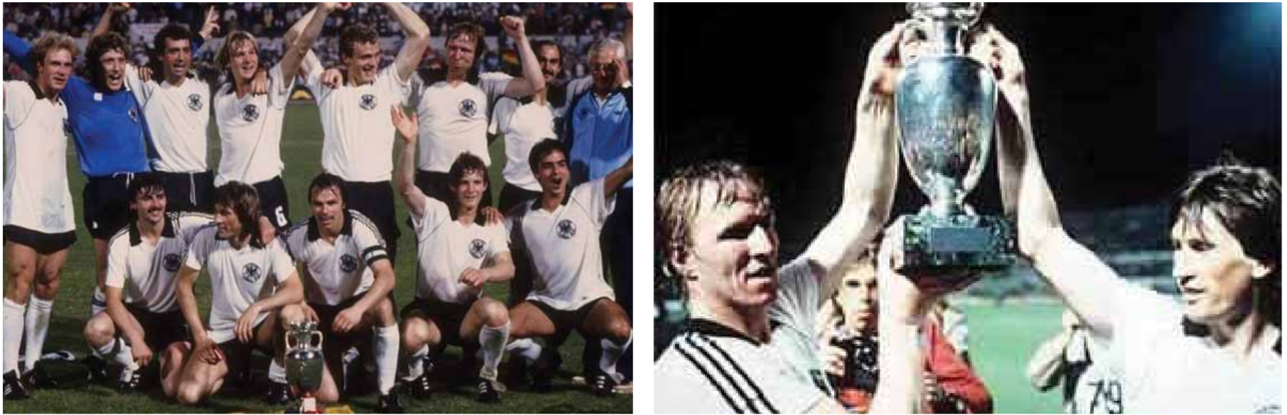
هروبيش عريس النهائي

ركلة جزاء هي الوحيدة في مسيرته الدولية الممتدة ٩١ مباراة دولية، ولعب أصحاب الأرض والبلجيك مباراة تحديدي طرف رومينيفه هدفاً البوندسليغا وللاعب أورويبا الموقف برأسية، وفاجت اليونان الغائبة عن الأعداد الكبرى منذ ١٩٧٢ سكتلب النهائي، وأن هولندا التي أنهلت العالم قبل سنوات سنتهي جيلها الذهبي دون تتويج، وأن هدف كيغان أفضل لاعب أورويبي ١٩٧٨ و١٩٧٩ لن يسجل، وأن إيطاليا المدعومة بعامل الأرض والجمهور ستكفي بهدف في دور المجموعات، ولكن تلك كانت الحقائق، إذ تساقط الكبار كورق الخريف باستثناء الألمان الذين وضعوا حداً للمغامرة البلجيكية، رغم أنهم بدأوا التصفيات بالتعادل السلبي مع مالطا وتركي.