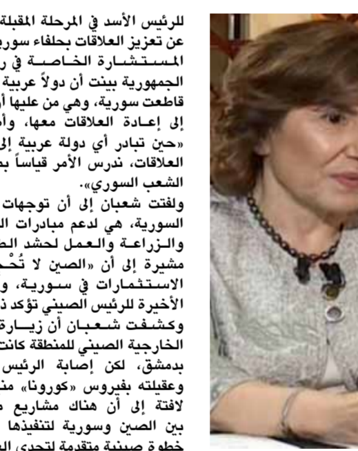
الدكتورة بنية شعبان

للرئيس الأسد في المرحلة المقبلة، فضلاً عن تعزيز العلاقات بحلفاء سورية. المستشارية الخاصة في رئاسة الجمهورية بينت أن دوماً عربية هي من قاطعت سورية، وهي من عليها أن تبادر إلى إعادة العلاقات معها، وأضافت: «حين تبادر أي دولة عربية إلى إعادة العلاقات، ندرس الأمر قياساً بمصلحة الشعب السوري». ولفتت شعبان إلى أن توجهات الدولة السورية، هي لدعم مبادرات الصناعة والزراعة والعمل لحشد الطاقات، مشيرة إلى أن «الصين لا تُحجَم عن الاستثمارات في سورية، والبرقية الأخيرة للرئيس الصيني تؤكد ذلك». وكشفت شعبان أن زيارة وزير الخارجية الصيني للمنطقة كانت ستبدأ بدمشق، لكن إصابة الرئيس الأسد وقلعته بغيروس «كورونا»، منع ذلك. لافتة إلى أن هناك مشاريع مقترحة بين الصين وسورية لتنفيذها «وهذه خطة صينية مقدمة لتحدي العقوبات الأميركية».