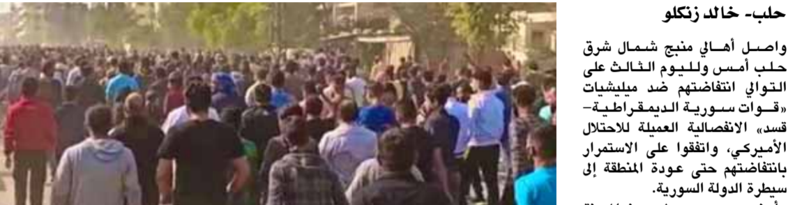
عشرات القوى تؤدي انتفاضة منبج ضد ميليشيات «قسد» (عن الانترنت)

لن تذهب سدى ولا أن تراجع عن الحركة ولا تتنازل عن مطالبهم المحقة التي تعدت الأمور المعيشية