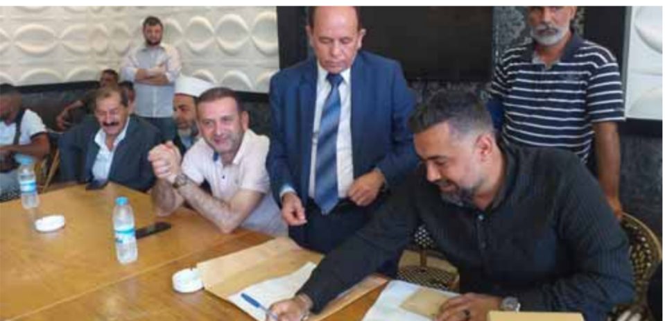
البدء بدفع تعويضات للذين تعرضوا لاعتداءات في لبنان أثناء الإزالة بأصواتهم في الاستحقاق الرئاسي السوري

وسبق لوزير الخارجية السوري، وليد الخليل، أن أعلن عن بدء دفع تعويضات للمتضررين من الاعتداءات التي طرقت الناخبين في الانتخابات الرئاسية السورية، وذلك في إطار التعاون مع الجهات المعنية لتسهيل عودة المهجرين. وقال الخليل، «إننا نعمل على تسريع عملية دفع التعويضات للمتضررين من الاعتداءات التي طرقت الناخبين في الانتخابات الرئاسية السورية، وذلك في إطار التعاون مع الجهات المعنية لتسهيل عودة المهجرين».