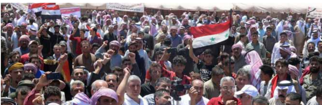
من تجمع وجهاء العشائر والقبائل السورية في محافظة حلب ضد ممارسات ميليشيا «قسد» الإجرامية ورفضاً للاحتلالين الأمريكي والتركي