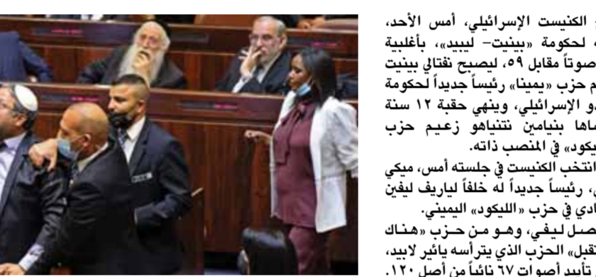
فردراب خلال جلسة عامة بالكنيست بعد عقدهم مع بينيت (من اليمين)