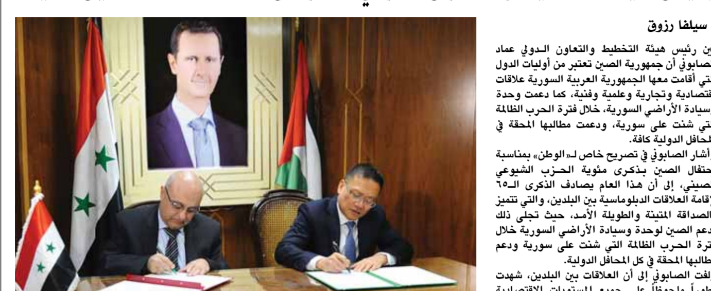
سورية والصين توقعان اتفاقية تعاون اقتصادي وفتي (من اليمين)