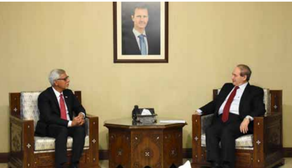
وزير الخارجية والمغتربين فيصل المقداد خلال استقباله الأمين العام للاتحاد جاجان تشاباغين

السوري في التحديات والصعوبات التي يمر بها بسبب الحرب الإرهابية عليه، مبدئين إعجابهم بالصمود الذي أظهره الشعب السوري بقيادة الرئيس بشار الأسد. وفي تصريح له، «الوطن»، أشار رئيس وفد المؤتمر القومي الإسلامي، خالد السفياني، إلى أن الوفد قرر أن يقوم بزيارة إلى دمشق وبيروت من أجل مشاركة الشعب السوري والقيادة السورية والجيش العربي السوري في الانتصارات المتتالية التي توجت بإعادة انتخاب الرئيس الأسد باعتباره استفتاء على خط المقاومة وعلى النهج الذي سار عليه من أجل سورية والأمة وفلسطين، ومن أجل الاحتفال مع المقاومة اللبنانية بعيد التحرير والمقاومة، ومشاركة الفلسطينيين الاحتفال بالنصر.