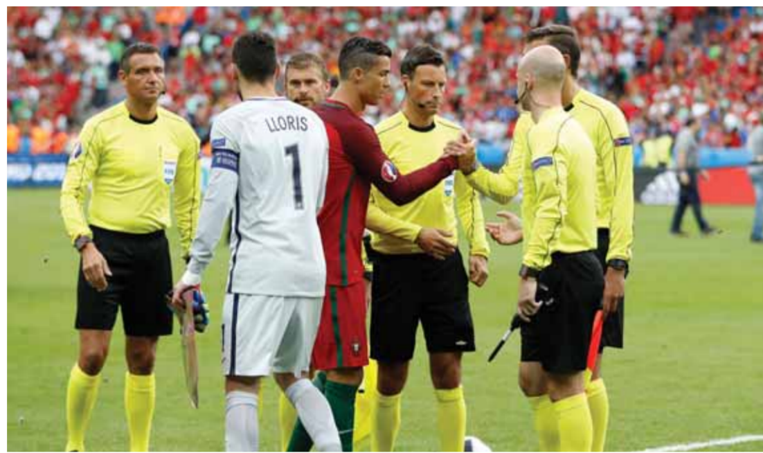
مارك كليتيندغ ومراسم نهائي ٢٠١٦