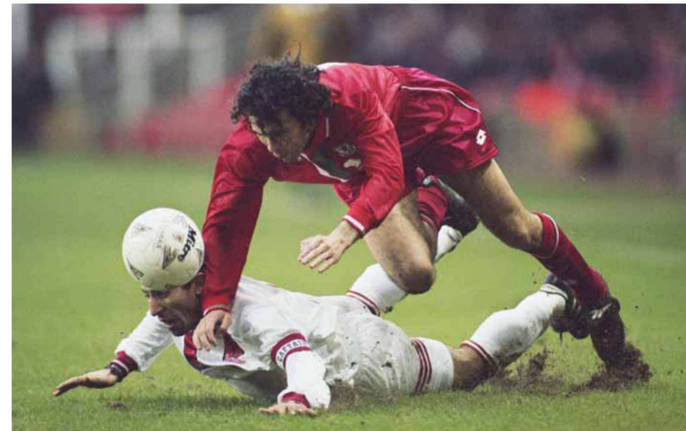
من لقاء الأمل العشرة بين ويلز وتركيا