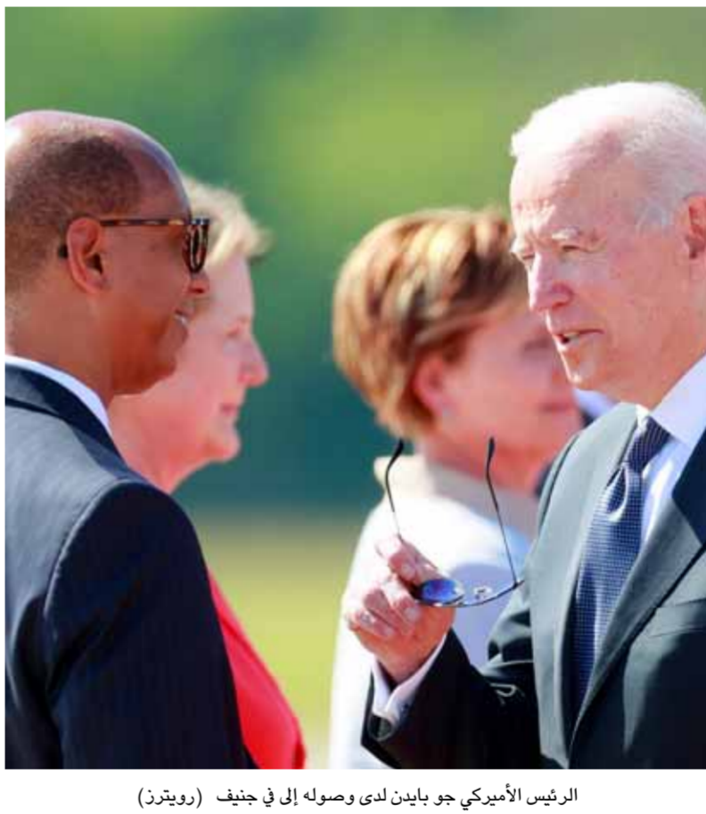
الرئيس الأميركي جو بايدن لدى وصوله إلى جنيف

عن بايدن وبوتين وزيرا الخارجية الأميركي أنتوني بلينكن، والروسي سيرغي لافروف، إضافة إلى مترجمين، وقبل بدء هذا الجانب من الاجتماعات يسمح للصحفيين بالدخول إلى القاعة لإجراء تصوير بروتوكولي، وأضاف: «الاجتماع الموسع سيجري بمشاركة مسؤولين آخرين من قبل كل من الطرفين». وسبق أن أعلن بيوري أوشاكوف، نائب الرئيس الروسي، أن المحادثات يتوقع أن تركز على بحث «القضايا التي تمثل مباحث إزعاج مشترك في العلاقات الثنائية»، موضحاً أن الزعيمين سيناقشان مواضيع الاستقرار الاستراتيجي ومكافحة جائحة عدوى فيروس كورونا «كوفيد ١٩» والجريمة السيبرانية والملفات الإقليمية مثل الأزمة الأوكرانية والأوضاع في الشرق الأوسط والنزاع الأذربيجاني- الأرمني في قره باغ.