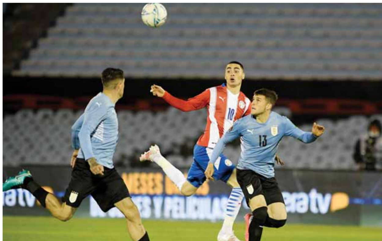
الأوروغواي والباراغواي قمة نحو الصافة

معدل سنين لفريق يبحث عن اللقب. وبالمقابل فإن المنتخب البوليفي يخوض المباراة من أجل السعفة لا أكثر ولا أقل بعد ثلاث هزائم متلقاها أمام الأوروغواي والباراغواي وتشيلي والبيرو بعد التعادل سلباً مع فارق أن الأخير أنه خسر في ١١ مباراة متتالية منذ فوزه على الإكوادور في نسخة ٢٠١٥. تاريخياً لم يعرف المنتخب البوليفي الفوز على نظيره الأرجنتيني سوى خمس مرات خلال ٣٨ مواجهة تلقى خلالها ٢٦ هزيمة لكن الخضر حققوا انتصاراتهم الخمسة على المستوى الرسمي ولعل أشهرها نتيجة ١/٦ الشهيرة في تصفيات مونديال ٢٠١٠ وأخيراً الفوز في تصفيات مونديال ٢٠١٨ بنتيجة ٢/٠ صفر أما الأول على هذا الصعيد فكانت في تصفيات ١٩٨٨ وانتهت ٢/٠ صفر كذلك وجميعها في لاباز. أما في كوبا أميركا فقد تقابلا ١٥ مرة ففاز أبناء التانغو في ١٢ منها مقابل تعادل وحيد في بيوش آيس عام ٢٠١١، وفوزان كانا على أرض لاباز أيضاً في نسختي ١٩٦٣ و١٩٧٩، والفوز الأخير للأرجنتين فكان بنتيجة ٣/٠ صفر في النسخة المتوية ٢٠١٦.