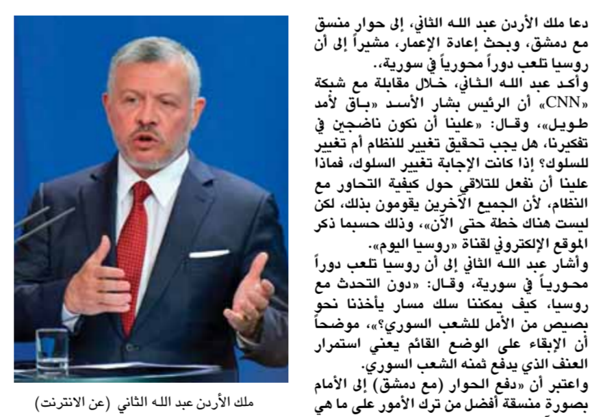
ملك الأردن عبد الله الثاني (من الأشرطة)