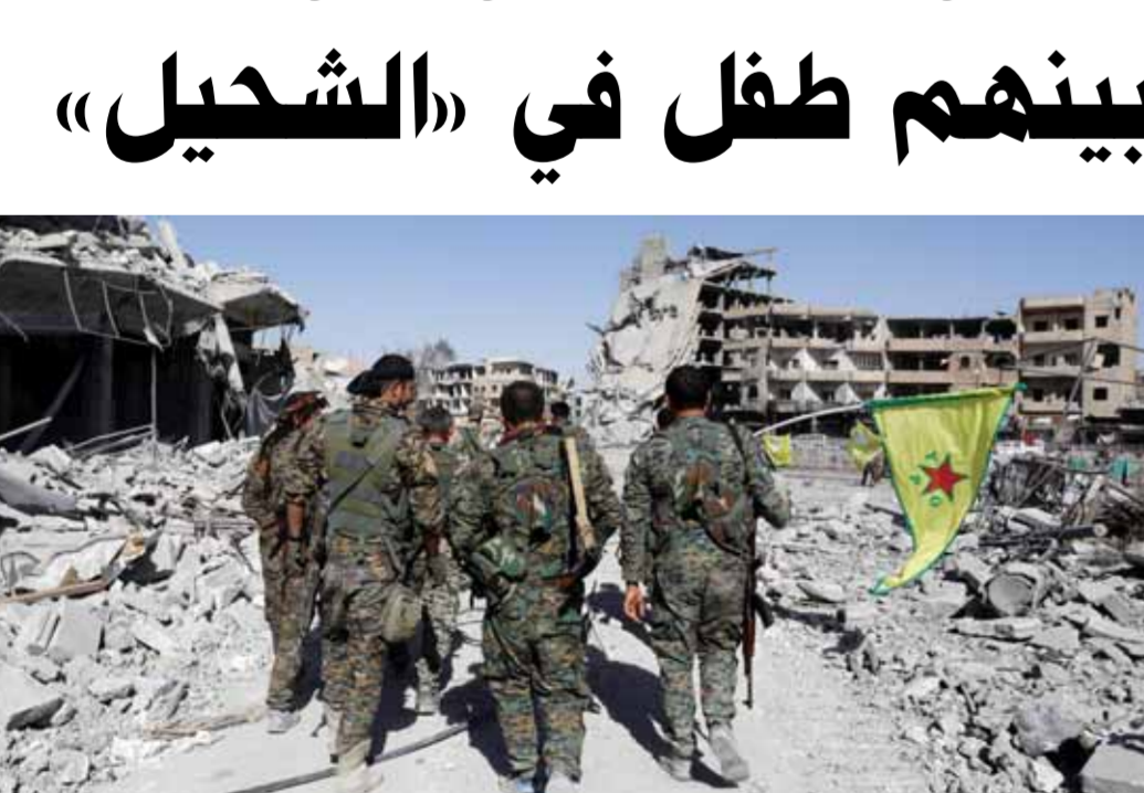
دمامة فرة كبيرة من مسلحي ميليشيات «قسد» منزل عدة في بلدة الشحيل (من الأشرطة)