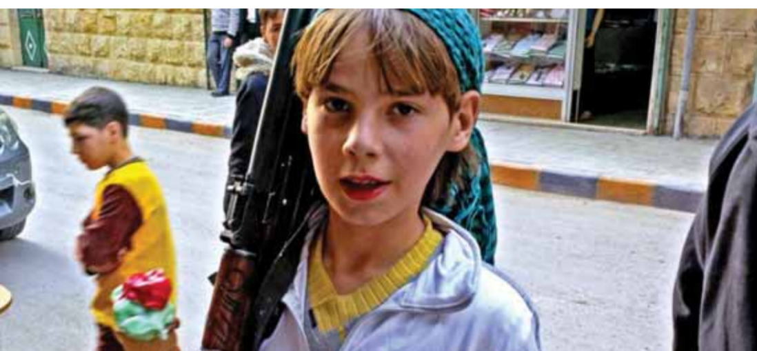
الضحايا السورية الثابتة لأثرة تواصل جنيد الأفتال (من الأشرطة)